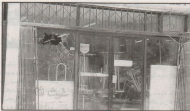
المعارض في الأخرى نالت تصويبها من الأذى