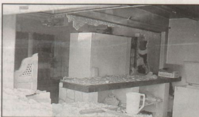
أحد المنازل لحقه الضرر من نار الإرهابيين العشوائيين