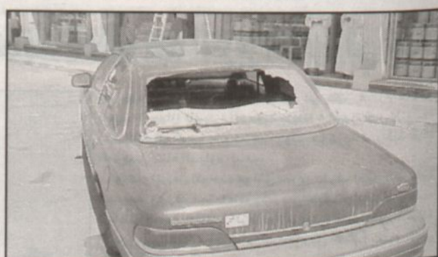
سيارات تعرضت لرمصاص الإرهاب