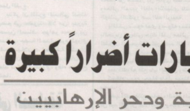
عدد من المواطنين والمقيمين يصفون مشاعرهم الرافضة لكل أنواع الإرهاب