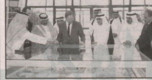
كوئز يطلع على مجمع الجامعة