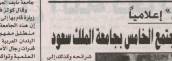
منظر للمعرض المصاحب للأسبوع

اختتمت يوم أمس الخميس فعاليات أسبوع الجامعة والمجتمع الخامس الذي افتتحه معالي وزير التعليم العالي الدكتور خالد بن محمد العنقري صباح الأحد الماضي في رحاب جامعة الملك سعود في المدينة الجامعية بالدرعية. ورشحه إلى إتحاد فرص العمل لأبنائنا الخريجين عن طريق يوم المهنة الذي يقدي المجتمع بالفكر السليمه المتواضقة مع متطلباته وبما يتوافق مع مصلحة الوطن. وقال وكيل جامعة الملك سعود، سمو الأمير الدكتور خالد بن عبدالله بن مقرن آل سعود، أن أسبوع الجامعة والمجتمع الخامس والذي تضمن يوم المهنة والمعرض والمصاحبة وعدد من المحاضرات والندوات والأنشطة المسرحية. هدف منه إيهاد فرصة عمل لخريجي الجامعة والالتقاء بمنسوبي القطاعات الأهلية وتذليل كل الصعاب التي تواجه الخريجين ليكون لبنة من لبنات هذا الوطن وقوة تساعدهم في الرقي والتقدم باذن الله. وأخيراً ها هي جامعة الملك سعود تحثمت هذا الأسبوع فخوراً بإنجازها وراغبة في معالجتها لمشكلات المجتمع ومساهمة في تطوره الدائم إن شاء الله.