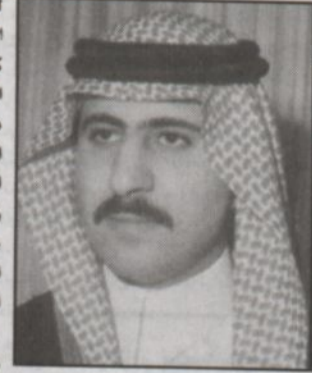
الأمير فيصل بن سلطان

كتب - مناحي الشيباني، أبدى صاحب السمو الملكي الأمير فيصل بن سلطان بن عبدالعزيز الأمين العام لمؤسسة سلطان بن عبدالعزيز الخيرية رغبة سموه في علاج الشاب الذي نشرته «الرياض»، معاناته يوم الخميس الماضي تحت عنوان (شاب يهدد شقيقاته بالاعتداء الجنسي) جاء ذلك في اتصال من استشاري ورئيس قسم الطب النفسي بمدينة سلطان بن عبدالعزيز الخيرية ب. (الرياض)، أوضح فيه توجيه صاحب السمو الملكي الأمير فيصل بن سلطان بن عبدالعزيز الأمين العام لمؤسسة سلطان بن عبدالعزيز الخيرية بعلاج الشاب المنشورة معاناته ب. (الرياض)، على حسابه الخاص بمدينة، حيث أعلن ذلك الدكتور ماجد القصبي مدير عام مؤسسة سلطان بن عبدالعزيز الخيرية.