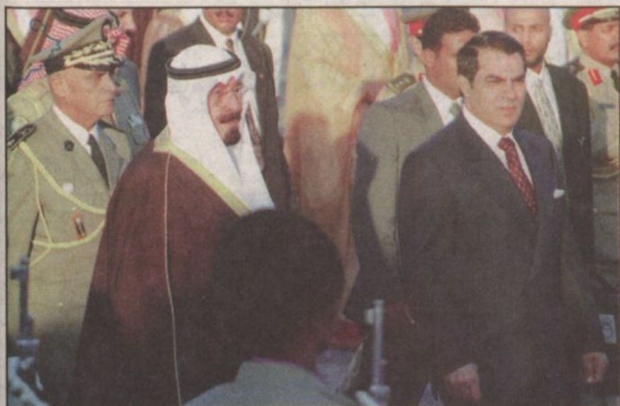
الأمير عبدالله والرئيس بن علي يستعرضان حرس الشرف