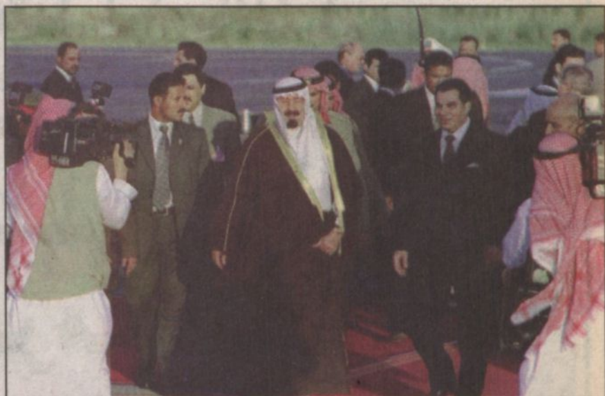
الرئيس بن علي مرشحاً بالأمير عبدالله لدى وصوله مطار تونس - قرطاج