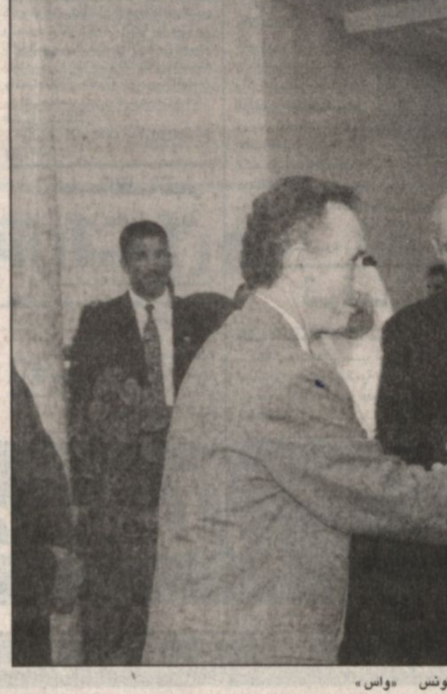
وصول سمو ولي العهد تونس «واس»

الصحف الجزائرية: زيارته سموه دفع كبير للعلاقات وهيئت زيارة صاحب السمو الملكي الأمير عبدالله بن عبدالعزيز ولي العهد نائب رئيس مجلس الوزراء رئيس الحرس الوطني على اهتمامات الصحف الجزائرية التي أبرزت على صدر صفحاتها الأولى أمس وقائع وصول سموه إلى العاصمة الجزائرية مع أول من أمس ومحادثات سموه مع فخامة الرئيس عبدالعزيز بوتفليقة مساء أول من أمس معتبرة الزيارة دفعا قويا لعلاقات التعاون الأخوي العلاقات الجزائرية السعودية قوامها التعاون. وأكدت صحيفة «الشعب» أن الزيارة تأتي لتعطي دفعة قوية للعلاقات الثنائية بين البلدين الشقيقين وتستدعم أواصر العلاقات المتصونة والصالح للشعبين مضيفة القول «إن هذه الزيارة ستضيف بعدا جديدا من أبعاد التلاحم العربي المنشود بين أقطار الأمة العربية في ضوء ما يتمتع به صاحب السمو الملكي الأمير عبدالله بن عبدالعزيز والرئيس عبدالعزيز بوتفليقة من حكمة سياسية مشهورة الأزمات المتعددة التي عصفت بها وأعربت الصحف عن قناعتها بأن هذه الزيارة المباركة ستتمكن من إيجاد ديناميكية اقتصادية جديدة يتجاوز تأثيرها البلدين تعتبر نموذجا في الشراكة العربية العربية. وتعرضت صحيفة «المسافة» من جهتها لمسيرة علاقات التعاون بين البلدين في مختلف المجالات مؤكدة أن زيارة سمو ولي العهد لتونس ستعطي دفعا جديدا للتعاون التونسي السعودي وتفتح أمام البلدين آفاقا جديدة لتطوير تعاونهما الاقتصادي ورفعته إلى مستوى العلاقات الممتازة القائمة بين قيادتي البلدين لما فيه خير الشعبين الشقيقين.