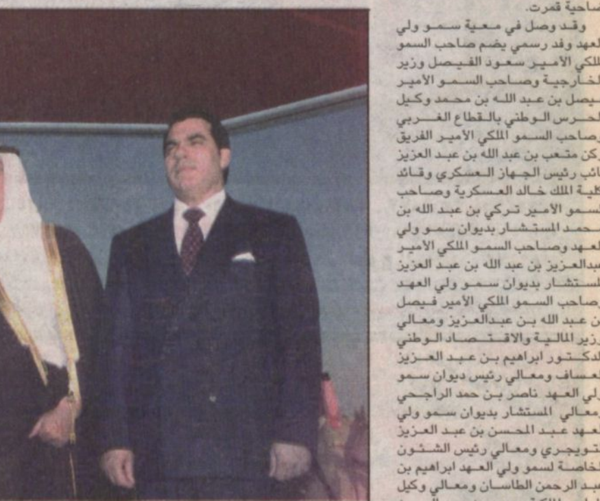
وصول سمو ولي العهد تونس «واس»

بعد ذلك عانق فخامة الرئيس عبدالعزیز بوتفليقة أخاه صاحب السمو الملكي الأمير عبدالله بن عبدالعزيز متمنياً له ولرفاقه سفراً