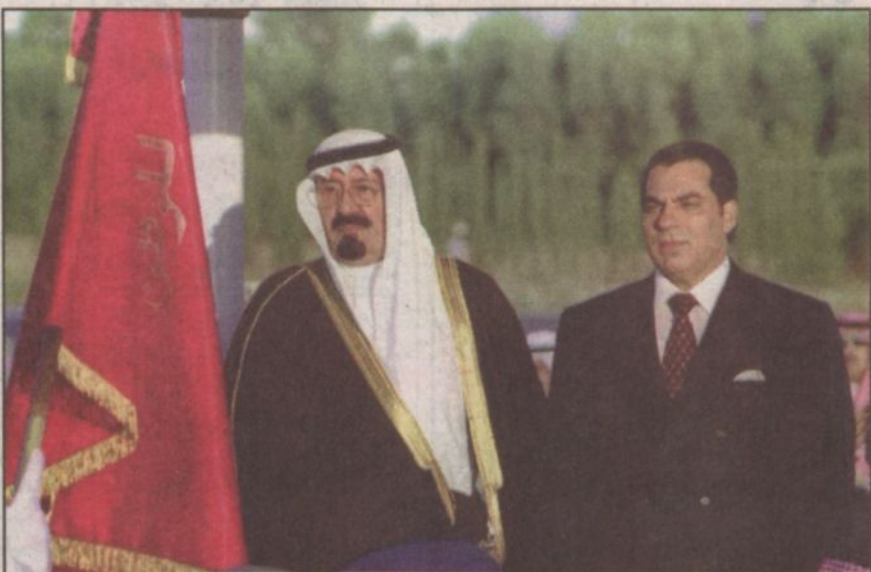
الرئيس بن علي على رأس استقبال الأمير عبدالله لدى وصوله إلى تونس