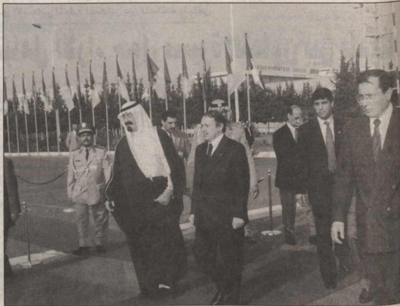
مغادرة سمو ولي العهد الجزائري