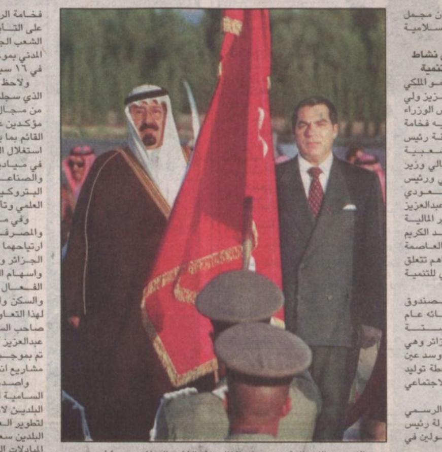
الأمير عبدالله والرئيس بن علي خلال عزف النشيد الوطني