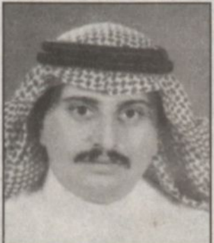
محمد بن عبدالعزيز