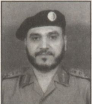
اللواء / محمد صالح العصيمي

عبدالعزیز آل سعود ولي العهد نائب رئيس مجلس الوزراء ورئيس الحرس الوطني يحفظه الله بافتتاح أحدث مطارات المملكة بل المنطقة بأسرها.