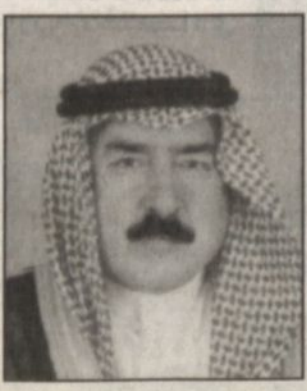
محمد بن عبدالعزيز