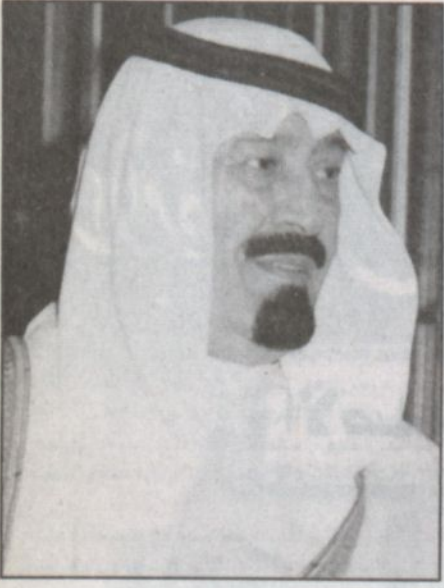
الأمير عبدالله بن عبدالعزيز

د. الربيع: سموه يفتتح مراكز الأورام والكلية ووحدته حديثي الولادة ونظام الصحة الإلكترونية ويضع الحجر الأساس لكلية الطب وتوسعة مبنى القلب ومركز الإصابات