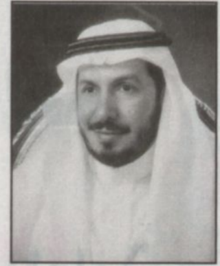
د. عبدالله الربيعه

سواء الرعاية الصحية الأولية أو المستشفيات العامة أو المراكز الطبية المتخصصة موضحاً في هذا الصدد بأن ذلك ضمن تقديم خدمات صحية جيدة للمواطنين وتقديم أفضل الخدمات للحوامل والأطفال سن الدراسة والتدريب المستمر للعاملين في مجال الرعاية الصحية الأولية. وشدد مدير صحة الحرس الوطني في ختام تصريحه على أهمية إيجاد قنوات في الاستفادة القصوى من الدعم المتاح وتعاون القطاعات الصحية في معالجة الترابط والتخطيط الصحي السليم والذي يخدم تطور الخدمات الصحية بين القطاعات المختلفة في الوطن.