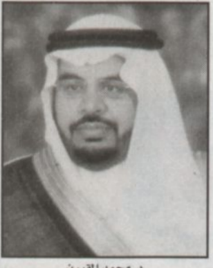
د. محمد المقيرن

كتبت - مندوب «الرياض»، أشاد معالي كلية الطب والمرف العام على المستشفيات الجامعية بجامعة الملك سعود الدكتور محمد بن مقرن المقيرن بحديث سمو ولي العهد حول تخصيص واحد وأربعين مليار ريال من الفائض المتوقع للميزانية للعام الحالي لمشاريع خدمية تنموية. وقال إن هذا التوجه الكريم ينبثق عن استراتيجية موقفة هدفها القيام بلبية احتياجات المواطن وسعادته نظراً للضغوط على موارد الميزانية السنوية نتيجة للنمو السكاني وكبر مساحة المملكة مما يرفع من معدلات التكاليف في جميع الخدمات سواء كانت تعليمية أو صحية أو غيرها. وفوه الدكتور المقيرن بتخصيص جزء من هذا الفائض لتطوير الرعاية الصحية الأولية بجميع مستوياتها سواء كانت