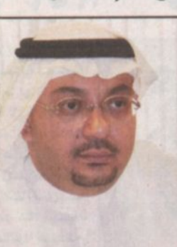
بقلم: د. سيف الدين أبو زيد *

تطل علينا هذه الأيام مناسبة سعيدة تحمل في طياتها أحداثاً مهمة لمواطني المملكة عموماً ولأهالي الرياض خصوصاً، والذين تعودوا على معايشة كل شيء مفرح ويأبى على السعادة، كيف لا وصاحب السمو الملكي الأمير عبدالله بن عبدالعزيز ولي العهد نائب رئيس مجلس الوزراء ورئيس الحرس الوطني يحمل بنفسه لواء البشارة لعامة المرضى الذين يسعدون أيما سعادة بإضافة هذا الصرح الطبي الكبير الذي يعد إضافة حقيقية لمنظومة المرافق الصحية الراقية بمملكتنا الحبيبة في ظل توجهات خادم الحرمين الشريفين الملك فهد بن عبدالعزيز - حفظه الله ورعاه - وذلك لما ستقدمه من رعاية طبية متكاملة لذوي الحالات المرضية المختلفة وخاصة الحرجة منها.