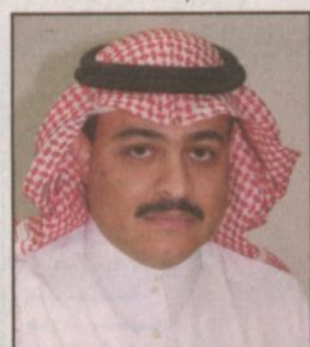
بقلم - محمد راشد الطلحة *

تفضل صاحب السمو الملكي الأمير عبدالله بن عبدالعزيز ولي العهد نائب رئيس مجلس الوزراء ورئيس الحرس الوطني بافتتاح مدينة الملك فهد الطبية ورعايته الكريمة لها اهتمام المسبق لولاة أمورنا بمختلف المشاريع الخدمية منذ العهد وحتى مرحلة الاكتمال ومباشرة المهام. ومدينة الملك فهد الطبية وبمات فيها من تجهيزات تعد بمثابة مفخرة لكل سعودي ظل يتباهى بمنجزات بلاده أمام العالم بأسره، وهي بلا شك أي المدينة اليوم أكثر فخرًا وثأقًا وهي تستقبل بكل الحب والترحاب صاحب السمو الملكي الأمير عبدالله بن عبدالعزيز ولي العهد في زيارة الكريمة لها، والتي من خلالها يواصل سموه جولاته التقديرية التي تهدف إلى خدمة المواطن وتحقق ما يتطلع إليه من رغبات وأمال تصب في إطار راحته وتطوره. ويؤدبه تعالى وكما هو متوقع له فإن الزيارة ستحقق أهدافها التنموية بصورة قوية تعود بالنفع والبركة لأهالي الرياض والمملكة عموماً وللعاملين بالمدينة.