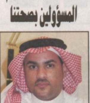
بقلم: أحمد الدخيل *

تسعى حكومة خادم الحرمين الشريفين بقيادة الملك فهد بن عبدالعزيز - حفظه الله - لتلبي احتياجات المواطنين لا سيما فيما يتعلق بصحتهم وهذا هو الشيء الذي تحرص عليه الدولة بمختلف أجهزتها وسعت ولله الحمد والمنة توفير كافة متطلبات الصحة العامة.