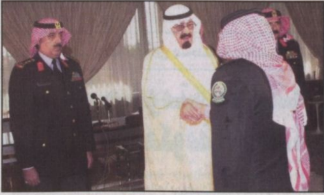
سمو ولي العهد يستقبل كبار ضباط الحرس الوطني

جميع الدول معتدلة الا من سولت له نفسه ويريد أن يسهه لهذا البلد فان الله سيسلط عليه أنتم لستم ضعفاء.. أنتم أقوياء بركم.. أقوياء بشخصياتكم.. أقوياء بايمانكم.. أقوياء بعقيدتكم باخلاصكم بشرفكم ولله الحمد.. ولا يوجد ان شاء الله على هذه البلد شيء يمسها أو يؤلمها أبداً.. أما الشبه الذي ما يصفه انسان أن يأتيك انسان لا أخلاق له ولا دين ولا عقيدة ولا ايمان ولا وفاء لهذا البلد.. نحن نعرفهم كلهم ولكن هؤلاء ماجورين آذاه وأذئاب.. كل من تكلم في المملكة العربية السعودية ولا أفقها لاني ابن من أبناء المملكة العربية السعودية هذه بلاسلكم.. كل من تكلم فيها لا بد أن يوضع في فمه حجر لان المملكة العربية السعودية وايه ولله الحمد لدينها ووطنها وصداقتها ووفائها لاصدقائها.