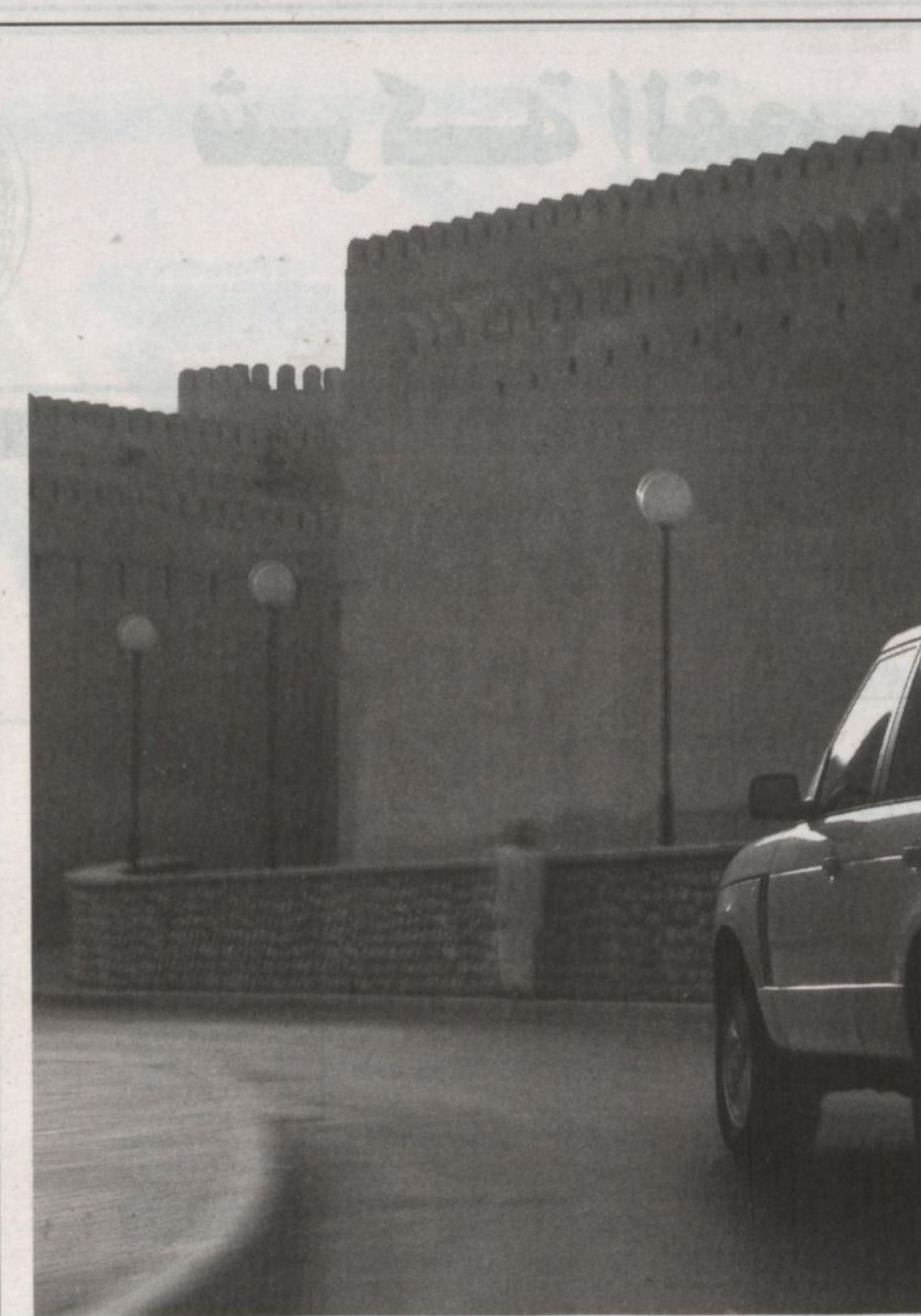
تحت سقف «ريج روفر» يجتمع نتاج تاريخ صناعة بأكملها ضمن تطوير أحدث تقنيات السلامة والأمان. بداية من وسائل هوائية توفر لركاب المقاعد الخلفية كما هي للأمامية. ومروراً بنظام ضبط التوازن ديناميكياً، ونظام توزيع مقدار القوة الكابحة بدقة إلكترونية تنوق التصور. ونظام ABS الذي يعمل على منع الغلغ المجلات بتقنية جبارة عند استخدام المكابح بشكل مفاجئ، وانتهاءً ببنية فولاذية لهيكل يتمتع بمعايير حماية تصاميم عالمية المستوى. النتيجة، قلعة بكل مائة الكلمة من معنى سوى أنها متحركة... لمن يعرف قدر نفسه