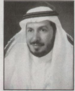
د. عبدالله الربيعة

كتب - محمد الحيدر، قال معالي الدكتور عبدالله بن عبدالعزيز الربيعة المدير العام للتشغيل لشؤون الصحة للحرس الوطني إن ما حملته حديث سمو ولي العهد من قرارات تصب في مصلحة المواطن يؤكد قوة ونهج الاقتصاد السعودي وحرص ولاة الأمر حفظهم الله على دعم المشاريع الخدمية وتوفير الرفاهية للمواطن بالدرجة الأولى. وأكد معاليه في تصريح لـ «الرياض» بأن تخصيص جزء من الفائض للمواطن لبرامج الرعاية الصحية الأولية يعتبر خطوة هامة خاصة وأنها في المستوى الأول لاتصال أفراد المجتمع بالخدمات الصحية سواء في المراكز الصحية