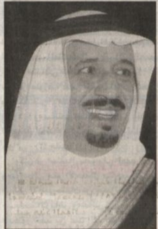
الأمير سلمان بن عبدالعزيز