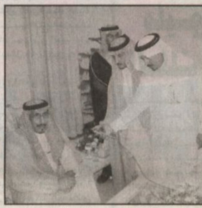
الأمير مشعل يتحدث للصحفيين

وأضاف سموه الشكر لولاة أمرنا جميعاً وعلى رأسهم خادم الحرمين الشريفين وسمو ولي عهد