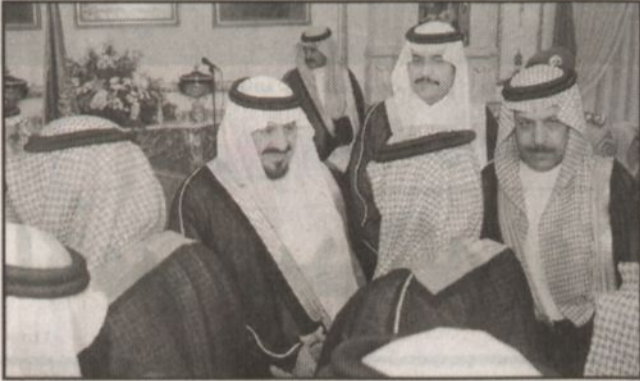
سموه يصافح حضور الحفل

لندن - (و.أ.س.)، بعث صاحب السمو الملكي الأمير عبدالله بن عبدالعزيز ولي العهد نائب رئيس مجلس الوزراء ورئيس الحرس الوطني رسالة إلى دولة رئيس وزراء بريطانيا توني بليير. وقام بتسليم الرسالة صاحب السمو الملكي الأمير تركي الفيصل سفير خادم الحرمين الشريفين في المملكة المتحدة وأيرلندا خلال اجتماعه أمس مع رئيس الوزراء البريطاني في مقر الحكومة البريطانية. وتضمنت الرسالة دعوة سمو ولي العهد لرئيس الوزراء البريطاني لحضور مؤتمر مكافحة الإرهاب الذي ستعظمه المملكة العربية السعودية في الخامس من شهر فبراير المقبل. كما بعث صاحب السمو الملكي الأمير سعود الفيصل وزير الخارجية رسالة مماثلة إلى وزير الخارجية البريطاني جاك سترو تتضمن دعوة معاليه لحضور هذا المؤتمر.