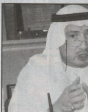
عون الله عون الله