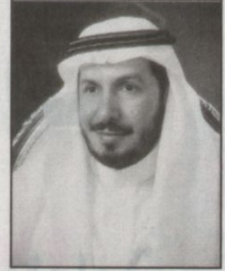
د. عبدالله الربيعه

سواء الرعاية الصحية الأولية أو المستشفيات العامة أو المراكز الطبية المتخصصة موضحاً في هذا الصدد بأن ذلك ضمن تقديم خدمات صحية جيدة للمواطنين وتقديم أفضل الخدمات للحوامل والأطفال سن الدراسة والتدريب المستمر للعاملين في مجال الرعاية الصحية الأولية. وشدد مدير صحة الحرس الوطني في ختام تصريحه على أهمية إيجاد قنوات في الاستفادة القصوى من الدعم المتاح وتعاون القطاعات الصحية في معالجة التراكمات والتخطيط الصحي السليم والذي يخدم تطور الخدمات الصحية بين القطاعات المختلفة في الوطن.