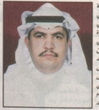
بقلم: عبدالعزیز بن عثمان الناصر

■ بهذه المناسبة الغالية والعظيمة في أن واحد يسرني السقوط إن زيارة صاحب السمو الملكي الأمير عبدالله بن عبدالعزيز ولي العهد نائب رئيس مجلس الوزراء رئيس الحرس الوطني وصحبه الكرام لمدينة الملك فهد الطبية اليوم تأتي لتتويجاً ودعماً للقائمين على أمر الصحة على مستوى مملكتنا عموماً