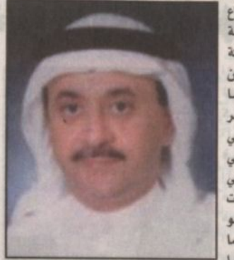
بقلم الأستاذ: محمد إبراهيم شمس

الخدمى بصورة عامة على مستوى المملكة باهتمام بالغ من الدولة بخلفية ما يشكله من عنصر أساسي وهام في حركة التنمية التي تعيشها المملكة في مختلف المجالات ذلك ان الإنسان هو أساس التنمية فمهما بلغت تكنولوجيا الآليات من تطور الا انها لازالت في حاجة لمن يأخذ بتشيكلها، ولكي يكون الإنسان مؤهلاً لذلك فلا بد من قوة جسمانية وعقلية ليستطيع من خلالها التأقلم مع تلك الآليات وهذا بالطبع لا يتأتى الا بالصحة والعافية. وللحقيقة فإن النمو في القطاع الصحي قد أخذ منحى كبيراً في عهد خادم الحرمين الشريفين حيث شهدت الكثير من المستشفيات الكبيرة والتي تضاهي في خدماتها أكبر المستشفيات على مستوى العالم العربي والإسلامي، هذا الى جانب الكثير من المراكز الطبية والمستوصفات.