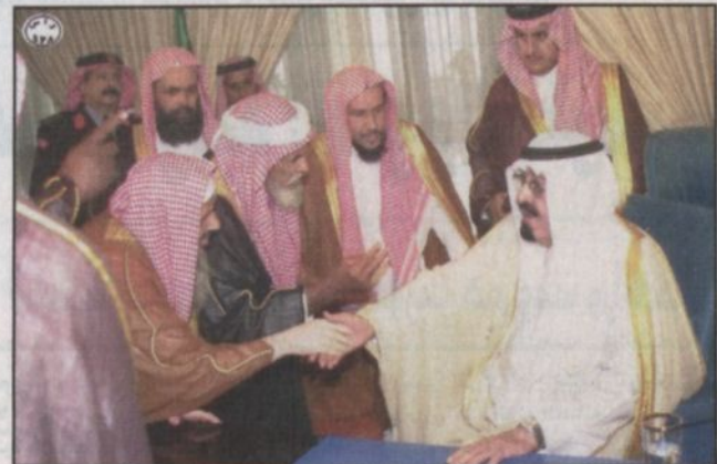
سمو ولي العهد خلال استقباله المواطنين

الرياض - واس، استقبل صاحب السمو الملكي الأمير عبد الله بن عبد العزيز ولي العهد نائب رئيس مجلس الوزراء رئيس الحرس الوطني في مكتبه برئاسة الحرس الوطني في الرياض أمس جمعا من المواطنين وقادة وضباط الحرس الوطني يتقدمهم صاحب السمو الملكي الفريق أول ركن متعب بن عبد الله بن عبدالعزيز نائب رئيس الحرس الوطني المساعد للشئون العسكرية الذين قدموا للسلام على سموه وتهنئته بسلامة الوصول إلى الرياض. وفي بداية الاستقبال أنصت الجميع إلى تلاوة آيات من القرآن الكريم مع شرحها وتفسيرها. كما استقبل سمو ولي العهد رئيس جهاز الإرشاد والتوجيه بالحرس الوطني الدكتور ابراهيم أبو عيابة ومجموعة من الدعاة والمرشدين بالحرس الوطني الذين اختتموا يوم أمس دورة المرشدين الأولى التي أقامها جهاز الإرشاد والتوجيه بالحرس الوطني.