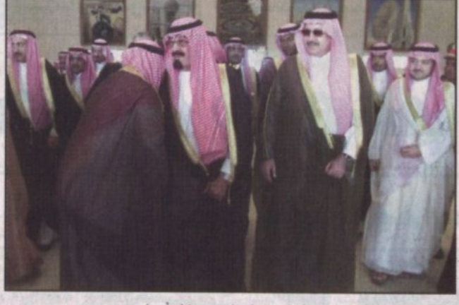
مغادرة سمو ولي العهد جدة

بيان من الديوان الملكي جاءنا من مجلس القضاء الأعلى ما يلي: الحمد لله وحده والصلاة والسلام على نبينا محمد وعلى اله وصحبه وبعد... فقد ثبت شرعاً لدى مجلس القضاء الأعلى ببيئته الدائمة رؤية هلال شهر شوال عام 1424هـ مساء هذا اليوم (الجمعة الموافق 29 / 9 / 1424هـ حسب تقويم أم القرى في الرياض والقصيم وسدير والقصوية وبهذا يكون يوم غد (اليوم) السبت الموافق 13 نوفمبر عام 2004م هو يوم عيد الفطر المبارك.