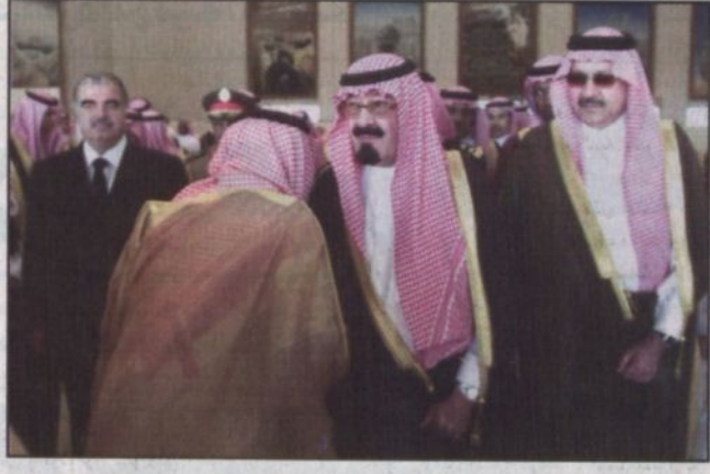
الأمير عبدالله يصاحف مودعيه في مطار الملك عبد العزيز

مكة المكرمة - واس: بعث خادم الحرمين الشريفين الملك محمد بن عبدالعزيز آل سعود برقية شكر جارية لشخامة الرئيس جورج دبليو بوش رئيس الولايات المتحدة الأمريكية.