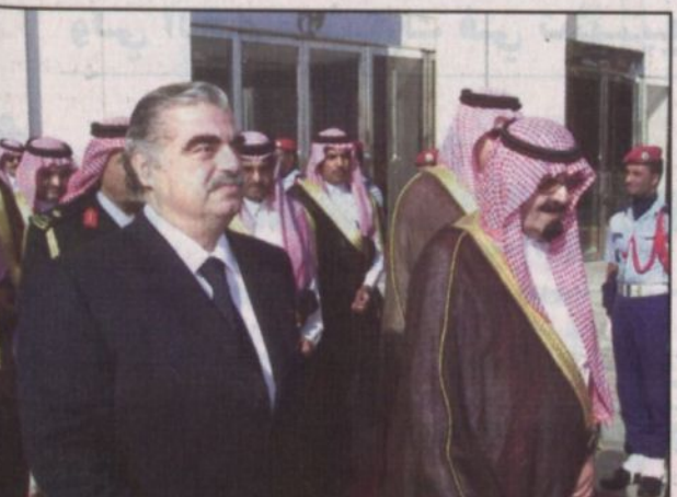
مغادرة سمو ولي العهد جدة (و.أس.)

العربية إبراهيم السعد البراهيم وأعضاء السفارة السعودية بالقاهرة. وكان صاحب السمو الملكي الأمير عبد الله بن عبدالعزيز ولي العهد نائب رئيس مجلس الوزراء رئيس الحرس الوطني قد غادر مكة المكرمة صباح أمس متوجهاً إلى جدة في طريقه إلى جمهورية مصر العربية الشقيقة.