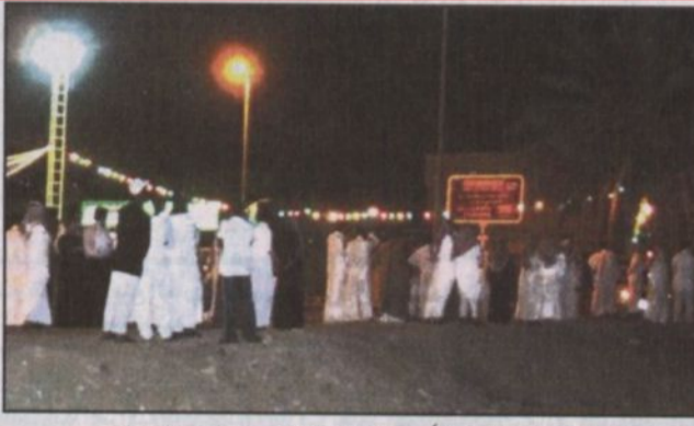
التجمهر يشكل خطراً على المواطنين والمقيمين يجب التنبه له