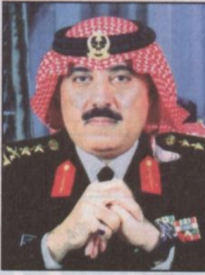
الفريق أول ركن الأمير متعب بن عبدالله

كتب - مندوب الرياض، يقوم صاحب السمو الملكي الفريق أول ركن متعب بن عبدالله بن عبدالعزيز نائب رئيس الحرس الوطني المساعد لشؤون العسكرية صباح يوم غد السبت 19/11/2004هـ بزيارة تفقدية لوحدة الحرس الوطني بالطواع الغربي في كل من المدينة المنورة وينبع حيث سيلتقي سموه بقيادة ومسؤولي لواء الملك فيصل وتنتهي بعيد الفطر المبارك وتنفذ جاهزية تلك الوحدات. يرافق سموه في هذه الزيارة عدد من كبار المسؤولين بالحرس الوطني.