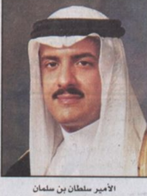
الأمير سلطان بن سلمان

جدة - واس، قام صاحب السمو الملكي الأمير سلطان بن سلمان بن عبد العزيز الأمين العام للهيئة العليا للسياحة بزيارة تفقدية لعدد من المشاريع والمرافق السياحية بمحافظة جدة. والتقى سموه خلال الزيارة برجال الأعمال القائمين على هذه المشاريع واطلع على الإمكانيات التي توفرها لمرتاديها وقدرتها على تلبية احتياجاتهم كما تعرف سموه على حجم الأقبال الذي تشهده خصوصاً خلال أيام عيد الفطر المبارك. وأشاد سموه بالتنوع الذي توفره المشاريع التي زارها والتنظيم الجيد الذي صاحب سير عملها كما نوه بإقبال الكفاءات الوطنية على العمل في هذا المجال الواعد. كما التقى صاحب السمو الأمين العام لهيئة السياحة بعدد من المواطنين والمقيمين مرتادي تلك المشاريع والسائح الداخلي.