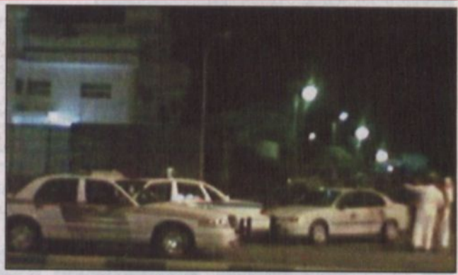
قوات الأمن لازالت تمشط حي القادسية