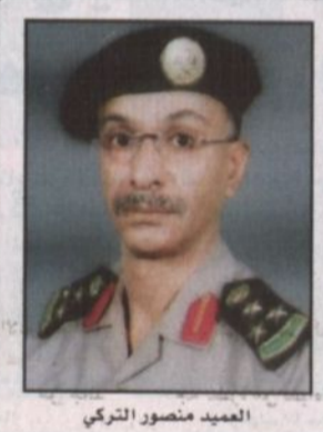
العميد منصور التركي

بوابة الداخلية العميد منصور التركي، ومن ناحية أخرى علمت "الرياض" من مصادرها الخاصة أن المقبوض عليهم في عملية عنيزة لم يكن أحد منهم على قائمة المطلوبين الـ 26.