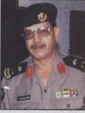
اللواء - خالد الطيب

بريدة - مضي، تمكنت القوات الأمنية بقيادة مدير شرطة منطقة القصيم اللواء خالد بن عيسى الطيب وبعض القيادات الأمنية ببريدة من إلقاء القبض على أحد المطلوبين أمنياً بأحد أحياء بريدة الجنوبية. ولم تكن هناك أي مقاومة تذكر رغم أن القوات الأمنية قد اتخذت كافة احتياطاتها لمواجهة أي طارئ يبادر به الموقوف كما قامت القوات الأمنية بقيادة مدير شرطة المنطقة بتعميق بعض المواقع بالمدينة ومنها مواقع بطريق حويلان كما تمكنت الأجهزة الأمنية مساء أمس في ملاحقة الفذة الضاللة والتي روعت الأمنيين وسفكت الدماء المعصومة وقد أقيمت الأجهزة الأمنية القبض على السيرة المشبوهة بها بحي الجردة ويؤكد هذا القبض مقدرتها الجهات الأمنية وتفوقها حيث تم التعرف على السيرة رغم تغير لونها وأخفاها بعض الملاحق للسيارة.