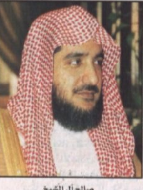
صالح آل الشيخ

كتب - مندوب الرياض، طالب معالي وزير الشؤون الإسلامية والأوقاف والدعوة والإرشاد الشيخ صالح بن عبدالعزيز آل الشيخ بأن تكون المرأة الداعية قوية في عملها النافع وأن تكون مستجيبة لربها في عملها الصالح، لأن العلم النافع المطلوب في هذا الصدد هو أن لا تكون متمككة في أمور لا تحسنها شرعاً، أو لا تعلم لأهل العلم فيها. وقال معالي الشيخ صالح آل الشيخ، إن الوضع اليوم يحتاج إلى كثير من الجد في التفهم، ثم الحد من العمل، ذلك أن المقترحات التي ابنت الله بها الأمة في هذه السنوات الأخيرة تستوجب منا الكثير من التوقف والتفكير دون تحرخ، أو تعدد في الاجتهادات، ومن دون نظر غير شرعي في تلك القضايا والمسائل، مبيناً معاليه أن المرأة صنو الرجل، والنساء شقائق الرجال، وكل من المرأة والرجل من أهل التكليف، والدعوة إلى الله - تعالى - جزء من التكليف، وشهد معاليه على أن المرأة الداعية مطلوب منها كما هو مطلوب من الرجل الداعية أن تكون باذلة وسعياً بحسب ما يتاح لها من الدعوة إلى الله - تعالى - لأنها هي الأساس وعليها اليوم ما ليس على غيرها في حل المشكلات في المجتمع، وايضاً إحياء لروح الفيرة عن هذا الوطن، وإحياء لروح الاهتمام بمكتسبات هذه البلاد، والتوحيد والعقيدة والسنة، والدعوة إلى الله تعالى، وكذا حب الوطن النابع من أساميات دينية عظيمة تجب المحافظة عليها شرعاً.