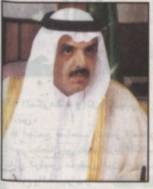
د. عبدالعزيز بن عياف آل مقرن

كتب - عبدالله الرشيد: يواصل سمو الأمير الدكتور عبدالعزيز بن محمد بن عياف آل مقرن أمين مدينة الرياض وأمين عام الهيئة العليا لتطوير مدينة الرياض تفقده المواقع الاحتفالية بمناسبة عيد الفطر المبارك لهذا العام ١٤٢٥هـ وذلك في مختلف أحياء العاصمة. ورافق سموه في هذه الجولة عدد من مسؤولي الأمانة رؤساء اللجان، كما اطلع على برامج ومراسم عمل اللجان العاملة في