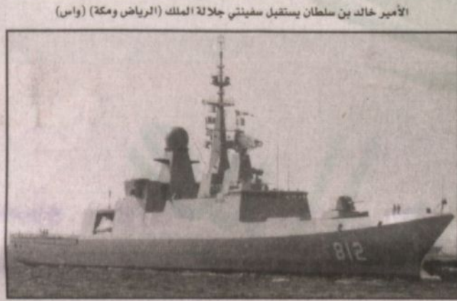
الأمير خالد بن سلطان يستقبل سفنيتي جلالته الملك (الرياض ومكة) (واس)

توجهات سمو الأمير سلطان لنا أن نرقى دائماً بالقوات المسلحة التي أعلى المستويات سواء غواصات أو خلافاً من الاسلحة المتقدمة في أي قوة من الافرع الاربعه للقوات المسلحة وهذا دالماً مجال الدراسة المستمرة من اللجان العسكرية والمتابعة الدائمة من اللجنة العليا للمتابعة. واكد سموه ان تطوير القوات المسلحة الجوية والبحرية والبرية والدفاع الجوي وتزويدها بالاسلحة المتطورة والمتقدمة مع مجال البحث