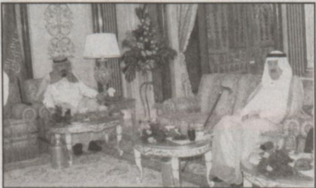
سمو ولي العهد خلال الاستقبال (واس)

المدينة المنورة - (واس)، وصلت دولة رئيسة وزراء بنغلاديش خالدة ضياء الى المدينة المنورة قادمة من دكا في زيارة للمملكة لأداء مناسك العمرة وزيارة المسجد النبوي الشريف. وكان في استقبال دولتها لدى وصولها مطار الأمير محمد بن عبدالعزيز وكيل إمارة منطقة المدينة المنورة المهندس عبد الكريم بن سالم الحنيني ومدير شرطة منطقة المدينة المنورة اللواء يوسف بن نصير البنيان وقائد منطقة المدينة المنورة اللواء عشق بن نجر الصقر ومدير عام مطار الأمير محمد بن عبدالعزيز المهندس عبدالفتاح بن محمد عطا وعدد من المسؤولين.