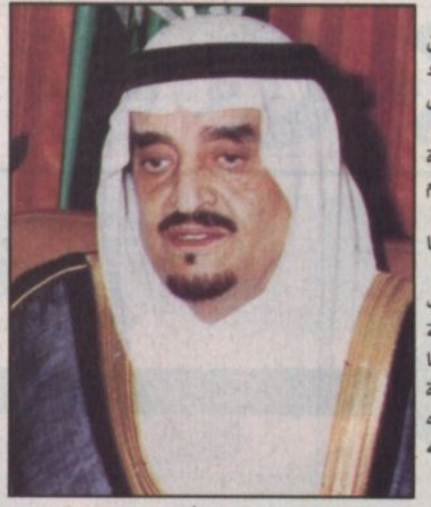
مكة المكرمة - (و.أ.س.) بعث خادم الحرمين الشريفين الملك فهد بن عبدالعزيز آل سعود برقية عزاء ومواساة في وفاة الرئيس ياسر عرفات فيما يلي نصها: إلى الاخوة الكرام أعضاء القيادة الفلسطينية حفظهم الله الصلوات عليكم ورحمة الله وبركاته.. وبعد ببالغ الألم وعميق الأسى تلقينا نبأ وفاة الرئيس ياسر عرفات.. واتنا إذ نعرب لكم ولدويهم وللشعب الفلسطيني باسم شعب وحاكمه المسلمة العربية السعودية وباسمنا عن أحر التعازي وأصدق المواساة لندعو الله العلي العظيم أن يتغمده بواسع رحمته ومغفرته ويسكنه فسيح جنته والحمد لله على فقائه وقدره. إننا لله وإنا إليه راجعون. خادم الحرمين الشريفين فهد بن عبدالعزيز آل سعود ملك المملكة العربية السعودية

كما بعث صاحب السمو الملكي الأمير عبد الله بن عبدالعزيز ولي العهد نائب رئيس مجلس الوزراء رئيس الحرس الوطني برقية عزاء ومواساة في وفاة الرئيس ياسر عرفات هذا نصها: إلى الاخوة الكرام أعضاء القيادة الفلسطينية حفظهم الله الصلوات عليكم ورحمة الله وبركاته.. وبعد فقد تلقينا بأسى عميق وألم بالغ نبأ وفاة الرئيس ياسر عرفات.. واتنا نعرب لكم ولدويهم وللشعب الفلسطيني شقيقين عن أحر التعازي وأصدق المواساة.. ولعلنا أن يتغمده بواسع رحمته ويسكنه فسيح جناته. والحمد لله على فقائه وقدره.