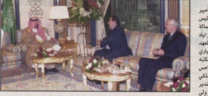
سمو ولي العهد مستقبلاً وزير خارجية العراق (و.أ.س.)

محمد بن سعود بن عبدالعزيز وكيل إمارة منطقة الباحة وصاحب السمو الملكي الأمير الوليد بن طلال بن عبدالعزيز وصاحب السمو الملكي الأمير عبدالعزيز بن عبدالله بن عبدالعزيز المستشار في ديوان سمو ولي العهد وصاحب السمو الملكي الأمير منصور بن ناصر بن عبدالعزيز وصاحب السمو الأمير الدكتور بندر بن سلمان بن محمد آل سعود المستشار في ديوان سمو ولي العهد وصاحب السمو الملكي