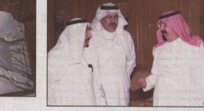
الأمير عبدالله يتابع خلال عرض مشروع الجمرات ويوجه بالحرص على سلامة وراحة ضيوف الرحمن

منطقة وجسر الجمرات الجديد في متى يعد نقلة نوعية في إعادة تخطيط منطقة الجمرات وتوفير الخدمات اللازمة للحجاج والذين تساهمهم على أداء الشعيرة وهم في سكنية ومطابنة.