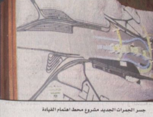
جسر الجمرات الجديد مشروع محط اهتمام القيادة

منطقة وجسر الجمرات الجديد في متى يعد نقلة نوعية في إعادة تخطيط منطقة الجمرات وتوفير الخدمات اللازمة للحجاج والذين تساهمهم على أداء الشعيرة وهم في سكنية ومطابنة.