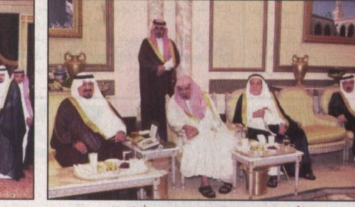
الأمير سلطان يستقبل رئيس مجلس الشورى وأعيان مكة

التعليم العام والمعاهد الفنية والمهنية والتنسيق مع القطاع الخاص لاستيعاب الشباب وأنا لشكرهم والعاملين معكم على جهودكم الطيبة وتنمى لكم التوفيق. واستقبل صاحب السمو الملكي الأمير سلطان بن عبدالعزيز النائب الثاني لرئيس مجلس الوزراء وزير الدفاع والطيران والمفتش العام في قصر سموه بالعزيرية بمكة المكرمة مساء أمس الأول عندما من المهندسين الممثلين للهيئة السعودية للمهندسين الذين قدموا للسلام على سموه وتنهته بقرب حلول عيد الفطر المبارك كما أكدوا الولاء والطاعة للقيادة الرشيدة ضد الفئة الباغية التي تبرص ضد بلادنا.