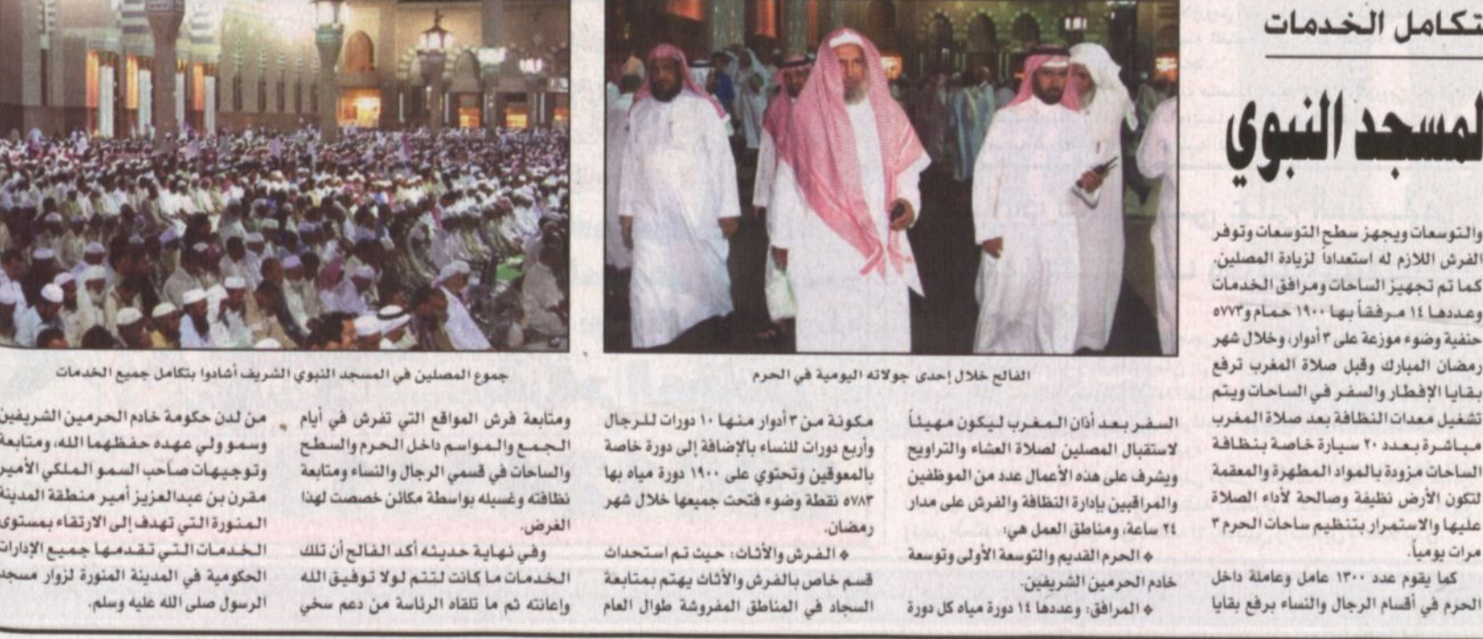
جموع المصلين في المسجد النبوي الشريف أشادوا بتكامل جميع الخدمات

والغربية والجنوبية الشرقية بعدد ١٠٠٠٠ وجدة ومدة، وتزويد جميع أجزاء الحرم بعدد ٧٠٠٠ (سبعة آلاف) ترمس من ماء زمزم العيود وعشرين خزائناً من ماء زمزم العيود موزعة في بعض المواقع بالساحات ويقوم بأعمال السقيا والفرش والنظافة والصيانة عمالة عددها ١٨٢٠ عاملاً وعاملة وجميع الأعمال تتم وفق خطط وبرامج معدة لموسم شهر رمضان ومنها إدارة خدمات الصيانة والسقيا وإدارة الساحات والمواقف. كما تمت وكالة الرئاسة إدارة الأعمال بعدد من الموظفين ليضيق العدد الإجمالي لمرافقي الساحات والمواقف ١٦٠٠ مرافق موزعين على خمس وديان لتقوم بالخدمات الموسّعة لها. كما تتولى إدارة الساحات