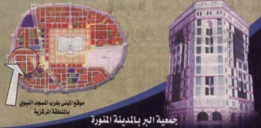
موقع المبنى بقرب المسجد النبوي بالمنطقة المركزية

تقديم عرضه بظرف مختوم إلى أمين عام جمعية البر شارع أبي ذر الغفاري أو إرساله بالبريد المسجل على ص.ب (٧٨٢) المدينة المنورة، ومن يرغب بزيارة المبنى فيإمكانه التنسيق على هواتف الجمعية.