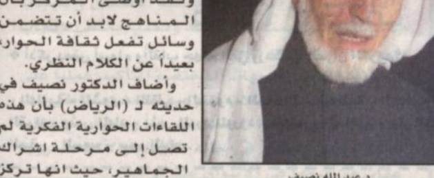
د. عبد الله نصيف

وأكد الدكتور عبدالله عمر نصيف أن مركز الملك عبدالعزيز للحوار الوطني ينوي تدريب (٤٠) ألف شاب وشابة على الحوار من خلال ورش عمل ودورات ولقاءات، ولقد اوصى المركز بأن تتضمن المناهج لابد أن تتضمن وسائل تفعل ثقافة الحوار، بعيداً عن الكلام النظري. وأضاف الدكتور نصيف في حديثه لـ «الرياض» بأن هذه اللقاءات الحوارية الفكرية لم تصل إلى مرحلة اشراك ميدانياً على بث روح الحوار بشكل تدريجي، وكذلك ازالة التوترات بين فئات الشباب. واختتم الدكتور نصيف قوله بنصيحة مقولة ان هذه اللقاءات التي تعاني اليوم ضيق، مهددة بالمشاركين الذين وجدوا بالفعل أن الأمر يستحق العناية.