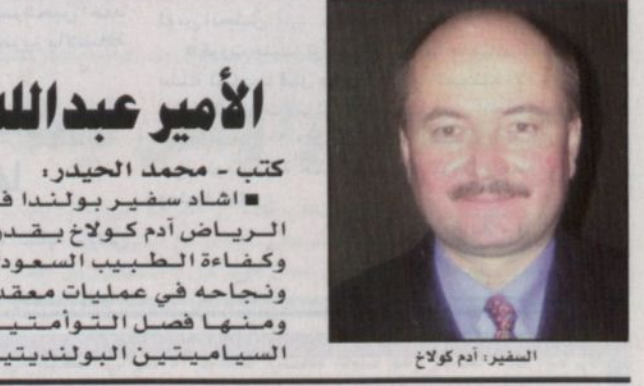
السفير، آدم كراغ

اسلام آباد - ش. أ، ارتفعت محصلة ضحايا موجة الطقس البارد التي اجتاحت اقليم بلوشتان الغربي الباكستاني إلى ٣٥ شخصاً بعد أن لقي أربعة أشخاص آخرين مصرعهم بسبب الثلوج التي حاصرتهم على طريق يربط مدينة كويتا بمنطقة عيسى خيل الباكستانية.