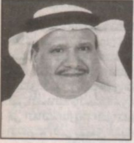
بقلم: سليمان تركي الفيضي