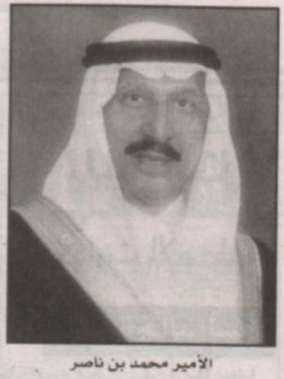
الأمير محمد بن ناصر

الحقباتي: التخصيص انطلاقة لرفاهية المواطنين