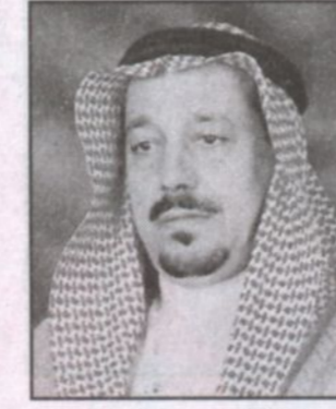
فهد بن محمد آل نوفل

الملك فهد بن عبدالعزيز وأكد أن العالم بأسره فجع بهذا النبأ حيث أن رحيل رجل بحجم الملك فهد الذي يمثل ثقلاً سياسياً ودولياً فهو بحق صدمة عظيمة للعالم اجمع ورفع آل نوفل تعازيه للأسرة المالكة وللشعب السعودي سائلاً الله العلي القدير التوفيق والسداد لخادم الحرمين الشريفين الملك عبدالله بن عبدالعزيز وولي عهده الأمين وان يسدد على طريق الخير خطاهم في كل ما من شأنه رفعة الوطن مجدداً العهد والولاء لخادم الحرمين الشريفين الملك عبدالله بن عبدالعزيز وولي عهده الأمين الأمير سلطان بن عبدالعزيز وقال: إننا نقف خلفكم صفاً واحداً ونحن على العهد ماحييناً لضمان استمرارية البناء والنماء في هذا البلد المبارك.