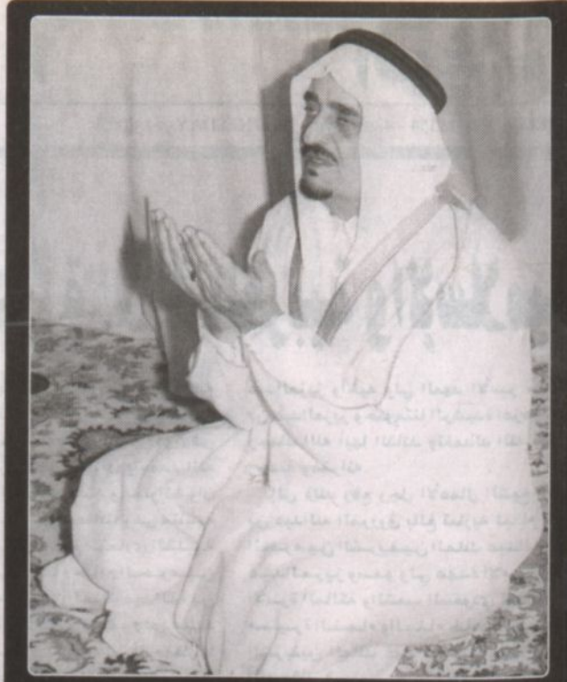
الملك فهد إلى رحمة الله ١٣٤٣ - ١٤٢٦ ١٩٢١ - ٢٠٠٥