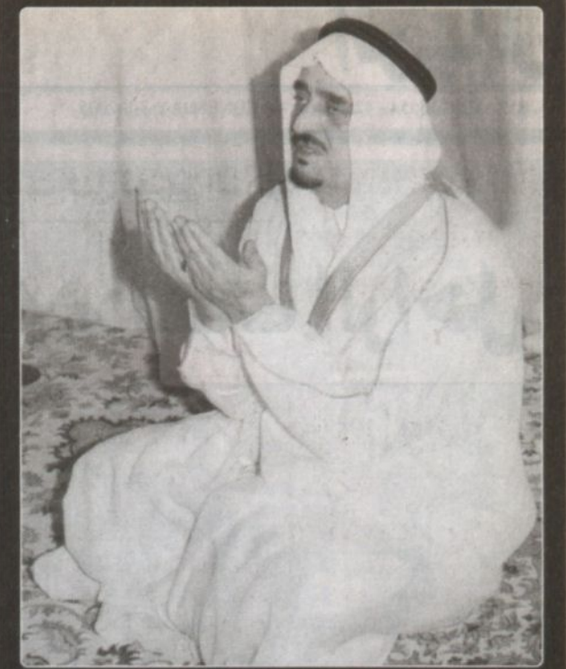
الملك فهد إلى رحمة الله ١٣٤٣ - ١٤٢٦ ١٩٢١ - ٢٠٠٥