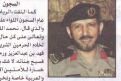
اللواء علي الحارثي