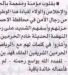
المقدم جابر الثبيتي

وصف خادم الحرمين الشريفين برجل الأمن حيث إنه واصل ما بدأه والده صقر الجزيرة الملك عبدالعزيز بن عبدالعزيز طيب الله ثراه في حفظ الأمن وسيادة حكم الله، فاهتم برحمته الله بالأمن وجعله من الأولويات لإيمانه رحمه الله بأن الأمن يتكمن من خلاله المواطن والمقيم أن يبتني ويتطور، فحقق الوطن معه ونه إنجازات تفت شاهدة اليوم على ربع قرن عاشه من العطاء والنماء والجهد والمغفرة وأنا له وأنا إليه راجعون.