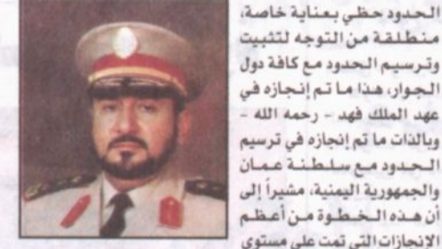
الفريق طلال فتاوي

متابعة - تركي البراهيم، التقى «الرياض» أثناء تواجدها في قصر الحكم بعدد من القيادات الأمنية والتي تواجدت منذ الصباح الباكر للسلام على خادم الحرمين الشريفين الملك عبدالله بن عبدالعزيز وتقديم واجب العزاء في الفقيه الملك فهد بن عبدالعزيز - رحمه الله - وقد تحدثت هذه القيادات عن مآثر الملك الراحل ومناقبه وما تم في عهده الميمون من إنجازات في القطاعات الأمنية وسعيه الدؤوب في الارتقاء بالعمل الأمني والوصول به إلى أعلى المستويات.