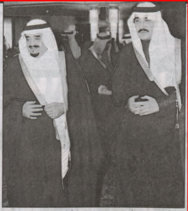
الفقيه الكبير في طريقه لأحد المناسبات الرياضية مع الأمير فيصل بن فهد (يرحمهما الله)

الدمام - مرشد الخالدي، بين الأستاذ إبراهيم العلي مستشار الرئيس العام لرعاية الشباب أن وفاة خادم الحرمين الشريفين الملك فهد بن عبدالعزيز رحمه الله هو مصاب جل على جميع أفراد الأمة الإسلامية نظراً لما يمثله رحمه الله من أهمية كبيرة لدى العرب والمسلمين لمواقفه وإسهاماته المتعددة والكثيرة لرفع شأن الأمة الإسلامية في العصر الحالي حيث إن دعمه الكبير لجميع الأنشطة الإسلامية ورعايته للكثير من المسلمين في كل أرجاء العالم لهو دليل مباشر لحبه الكبير للارتقاء والمساهمة في اعتلاء الأمة الإسلامية مركزاً مرموقاً في كل المواقف. وقال إبراهيم العلي إن الكلمات تعجز عن التعبير عن ما في النفس في مثل هذه المواقف المحزنة خاصة وأن الفقيه هو شخصية كبيرة ومهمة جداً فخادم الحرمين الشريفين الملك فهد بن عبدالعزيز له مكانته ومقامه وأدى ما عليه من عمل بأمانه وتمنى أن يفر الله له ويرحمه ويسكنه فسيح جناته ويبارك بالخلف خادم الحرمين الشريفين الملك عبدالله بن عبدالعزيز وولي عهده الأمين الأمير سلطان بن عبدالعزيز ويوفقهما ويجعلهما يداً واحدة في سبيل الحق والسير قدماً بالأمة الإسلامية والعربية والسعودية بما هو أفضل ودرجو من الله العزيز الجليل أن يلهم الشعب السعودي الصبر والسلوان وأن يتعمد الفقيه بواسع رحمته. أكد العلي إنه يصعب على أي شخص أن يحصي ما قدمه الملك فهد بن عبدالعزيز رحمه الله للمملكة فأنجازاته متعددة وفي القطاع الشبابي والرياضي كانت له أيدٍ بيضاء هي السر المباشر في وصول الرياضة السعودية إلى المحافل الدولية العالمية.