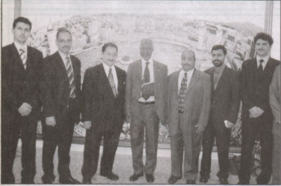
عنان يقدم التعازي