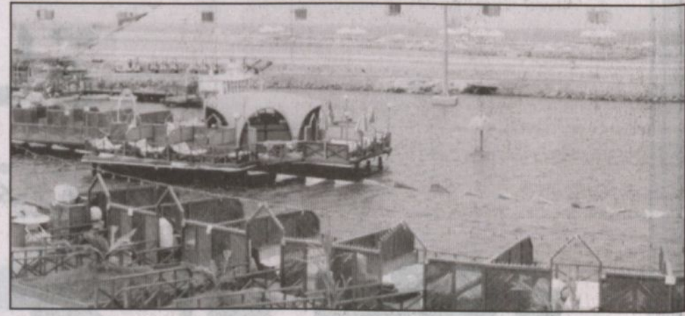
ميناء جدة الإسلامي