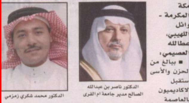
الدكتور ناصر بن عبدالله الصالح مدير جامعة أم القرى (يمين) والدكتور محمد شكري زمزمي (يسار)

مكة المكرمة - وائل اللهيب، عصا لله العصيمي، الحزن والأسى استقبال الأكاديميون بالعاصمة