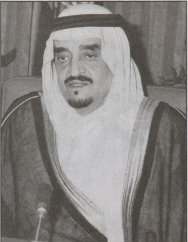
الملك فهد بن عبدالعزيز يرحمه الله.