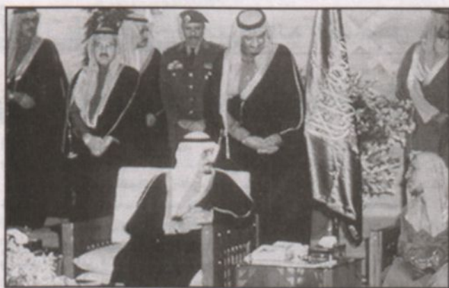
خادم الحرمين الشريفين - رحمه الله - يفتتح قصر الحكم بعد إعادة البناء