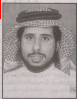
د. محمد كومان

عبر معالي الدكتور محمد بن علي كومان الأمين العام لمجلس وزراء الداخلية العرب عن عظيم حزنه بوفاته المغفور له بإذن الله - الملك فهد ملكاً كما أن أي صفحات يمكن أن تفي الملك فهد بن عبدالعزيز حقه، وأن تستوعب دوره، وأي كلمات يمكن أن ترتفع لهذا المصاب الجليل، للرجل الذي نذر حياته لخدمة أمته السعودية والعربية والإسلامية.