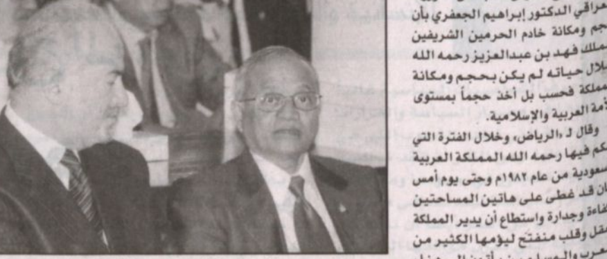
د. الجعفري شارك في تشييع جثمان الراحل الكبير

أوضح رئيس مجلس الوزراء العراقي الدكتور إبراهيم الجعفري بأن حجم ومكانة خادم الحرمين الشريفين الملك فهد بن عبدالعزيز رحمه الله لم يكن بحجم ومكانة المملكة فحسب بل أخذ حجماً بمستوى الأمة العربية والإسلامية.