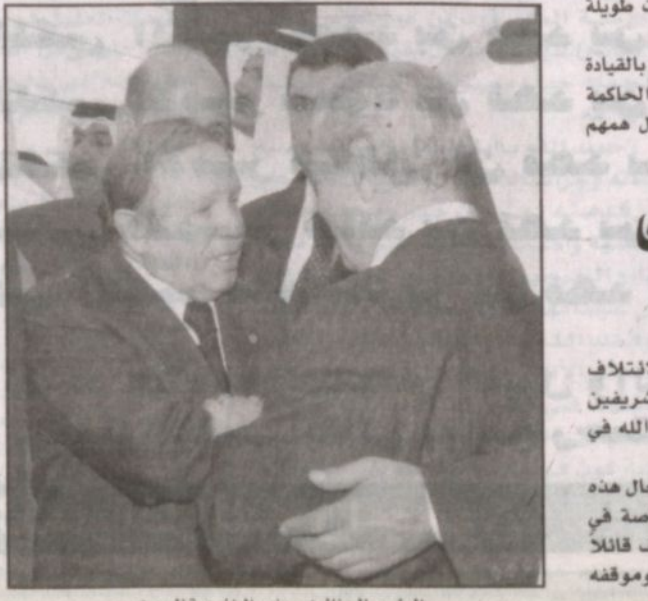
الرئيس الجزائري ووزير الخارجية السوري