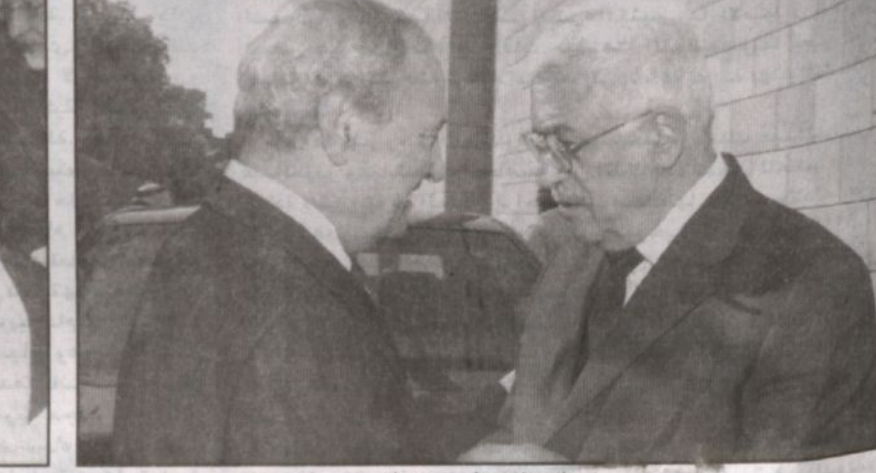
ابومازن والشرع في حديث جانبي