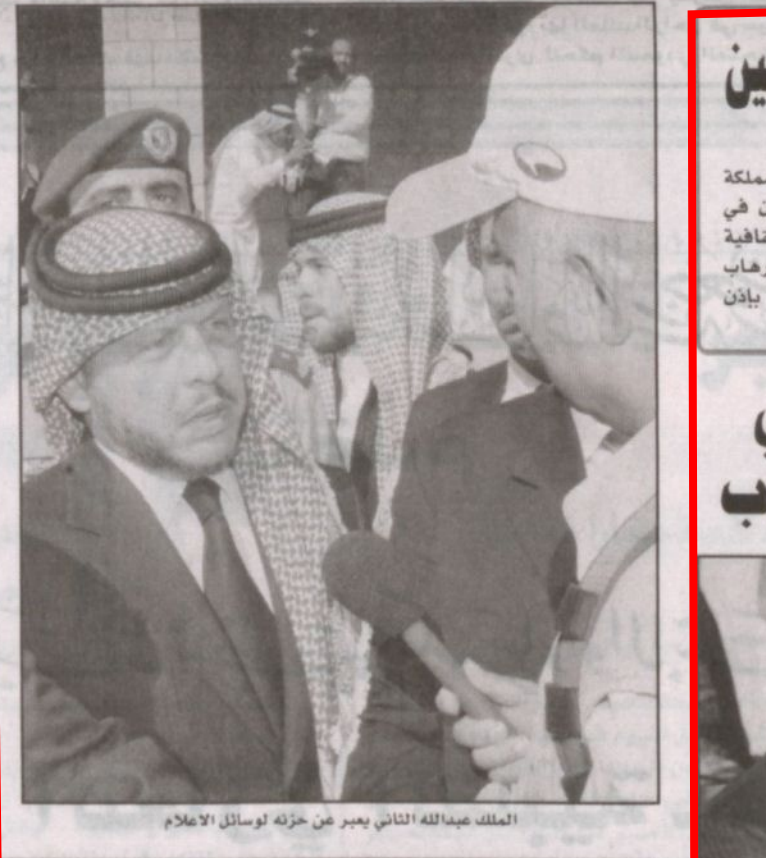
الملك عبدالله الثاني يعبر عن حزنه لوسائل الاعلام