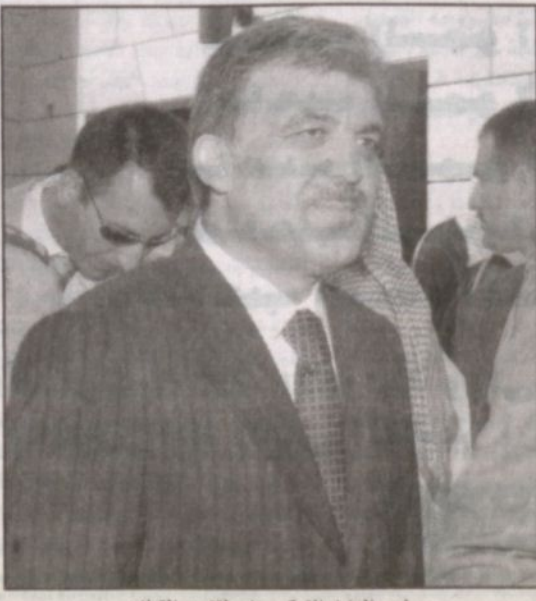
رئيس الوزراء التركي حضر لتقديم التعازي