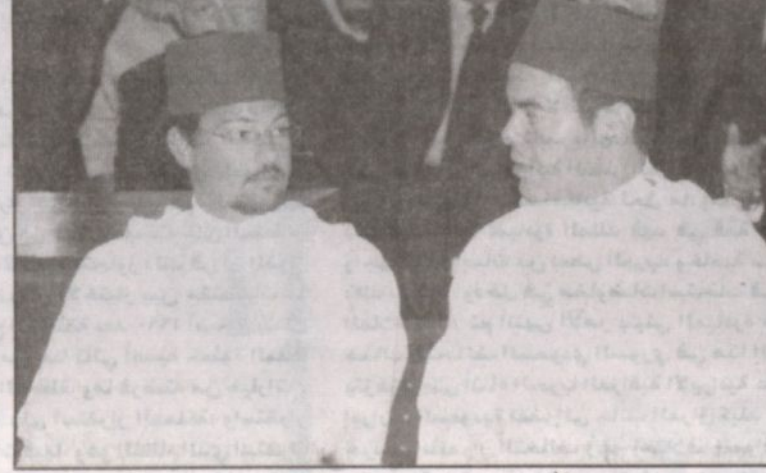
الأمير رشيد مثل المغرب في تشييع الفقيد

نحن خاصة كلبنانيين دائماً نذكر المغفور له بإذن الله تعالى خادم الحرمين الشريفين الملك فهد بن عبدالعزيز بكل خير لما كان يقدمه دائماً للبنان واللبنانيين الموجودين في لبنان أو في المملكة. وأضاف أن لخادم الحرمين