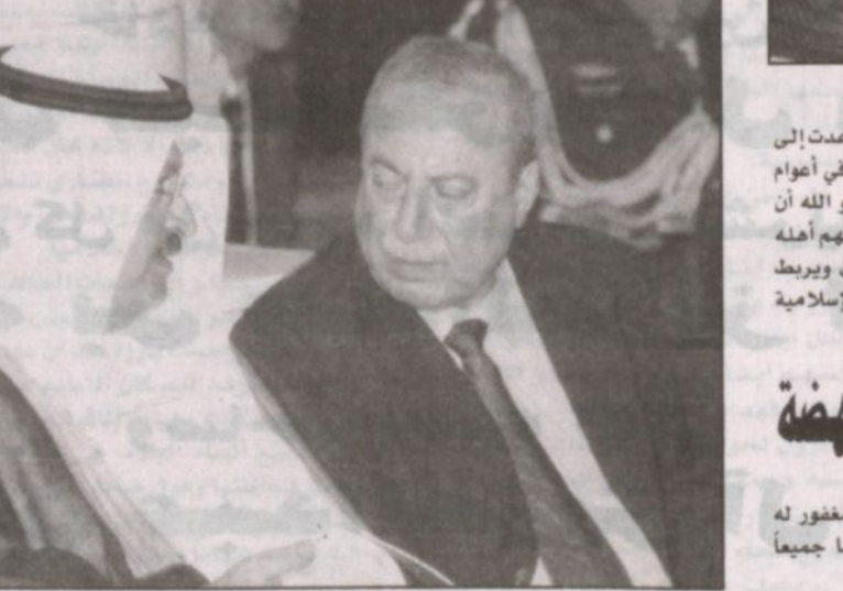
نائب الرئيس العراقي شارك في التشييع