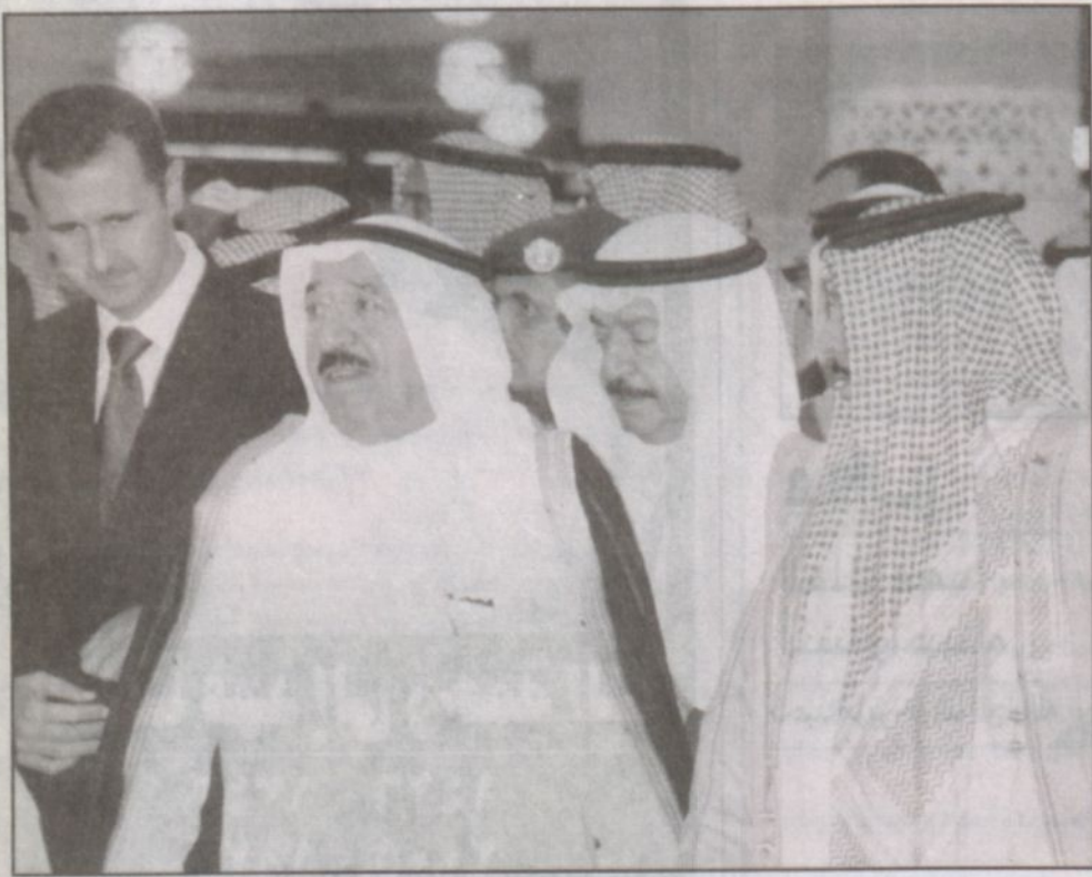
الملك حمد بن عيسى والشيخ صباح الأحمد والرئيس الأسد