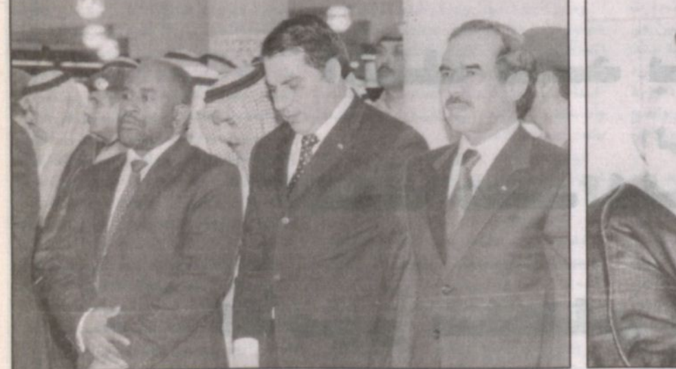
رؤساء موريتانيا وتونس خلال أداء الصلاة على الفقيد

قال رئيس الجمعية الوطنية العراقية الدكتور حاجم مهدي الحسيني بأننا نعزي أنفسنا وخواننا في المملكة في وفاة الملك فهد رحمه الله الذي قدم خدمات جليلة ليست للشعب السعودي فقط ولكن للأمة العربية والإسلامية جمعاء. وأشار إلى أن هذه الفاجعة تمثل خسارة كبيرة لسأل الله أن يعوضنا عنها بخير وأن يجعل خلفه خادم الحرمين الشريفين الملك عبدالله بن عبدالعزيز خير خلف لخير سلف. وأكد أن العلاقة بين المملكة والعراق علاقة تاريخية قديمة وعلاقة قوية جداً ونأمل أن تطور هذه العلاقات ونعيش على حسن الجوار والصداقة وهذه العلاقات ستبقى إن شاء الله متمية لأن هناك استعدادات بين الشعبين العراقي والسعودي وإن شاء الله ستتطور العلاقات مستقبلاً.