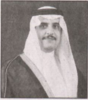
الأمير محمد بن فهد

الدهام - واس: قال صاحب السمو الملكي الأمير محمد بن فهد بن عبدالعزيز أمير المنطقة الشرقية إن وفاة خادم الحرمين الشريفين الملك فهد بن عبدالعزيز رحمه الله ليست خسارة للمملكة العربية السعودية فحسب إنما هي خسارة للعالم أجمع وفتان لشعنة مضيئة في تاريخ الإسلام والإنسانية. وأضاف سمو أمير المنطقة الشرقية في تصريح صحفي قائلًا إن الملك فهد بن عبدالعزيز رحمه الله نذر حياته للعطاء غير المحدود والعمل المتواصل والفكر المتقدم من أجل مواطنيه وبذل كل ما في وسعه لخدمة دينه وخدمة المسلمين أينما كانوا.. ويكفيه رحمه الله أنه رالد النهضة السعودية الحديثة التي اثمرت وامتدت لتشمل كل فروع العملية التنموية في بلادنا تعليمياً وعلمياً واقتصادياً وتجاريًا وعمرانياً.. ونوه سمو الأمير محمد بن فهد بعلاقات التلاحم بين القيادة والشعب قائلًا إن ما أحاط به شعبنا الوفي قائده الراحل من حب في حياته وهي مرضه وفي مماته يؤكد من جديد عمق العلاقة الاصيلية بين القائد وشعبه، مؤكداً أن تظاهرة الوفاء التي عبر عنها المواطنون بمختلف فئاتهم