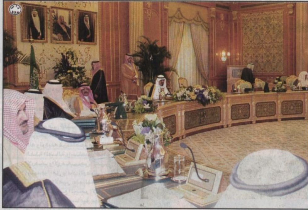
سمو ولي العهد ترؤساً جلسة مجلس الوزراء