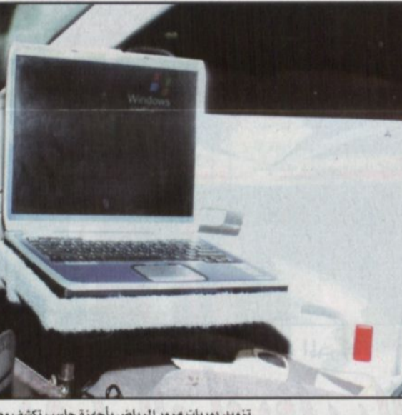
تزويد دوريات مرور الرياض بأجهزة حاسب تكشف وضع السيارات المطلوبة