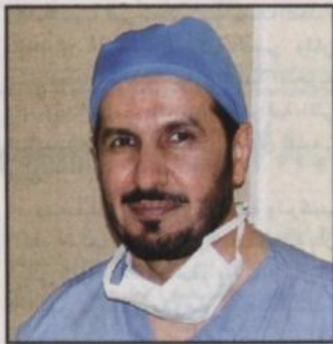
د. عبدالله الربيعه