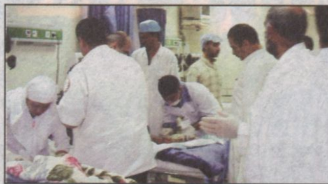
الكادر الطبي يقوم بتقديم الاسعافات للمصابين