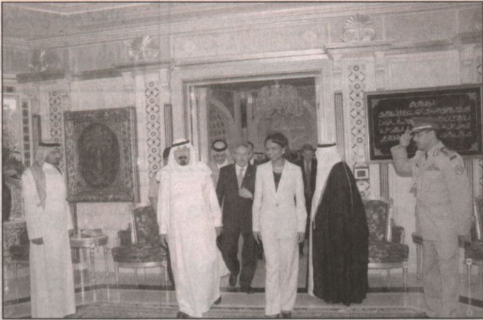
سمو ولي العهد يقبل حفلة عشاء تكريماً لعمالي وزيرة الخارجية الأمريكية