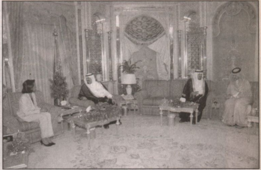
سمو ولي العهد يستقبل وزيرة الخارجية الأمريكية