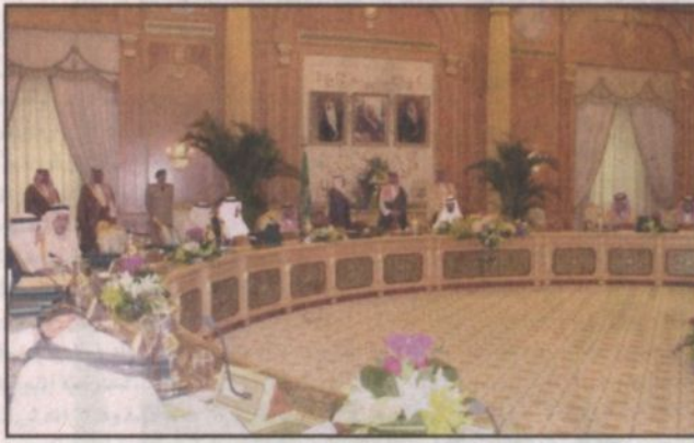
سمو ولي العهد يترأس جلسة مجلس الوزراء