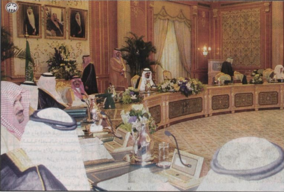
سمو ولي العهد ترأساً جلسة مجلس الوزراء

المساجد وتأهيل الخطباء والأئمة... ثالثاً... الموافقة على قيام وزارة التعليم العالي بتحمل تكاليف علاج والد المبتعث الذي يرافقه في مقر دراسته في الخارج إذا كان المبتعث هو العائل الوحيد لوالده بموجب صك إعالة شرعي. رابعاً... الموافقة على تفويض معالي وزير النقل أو من ينوبه بالتوقيع على «بروتوكول» توحيد قواعد وإجراءات مرور مركبات الدول المشاركة بين أراضيها وعبرها «بالترازيت»، في ضوء الصيغة المرقفة بالقرار. ومن أبرز ملامح مشروع هذا «البروتوكول» ما يلي.. ١ - يهدف إلى اعتماد «دفتر المرور» والمكث المؤقت للمركبات، واعتباره وثيقة رسمية موحدة لتتقل كافة فئات مركبات نقل الركاب والبضائع المسجلة في أي من الدول المشاركة بين أراضيها وعبرها «بالترازيت».