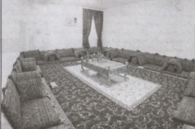
أحد غرف المجمعات السكنية

المنقولة في استثمارات منخفضة المخاطر بما لا يتعارض مع احكام الشريعة الإسلامية. يشكل مجلس الامناء كلما رأى حاجة لذلك لجنة في كل منطقة تقرر المؤسسة اقامة مشروع فيها وذلك لمساعدة المؤسسة في تحديد المستفيدين من مشاريعها ومواصفات المشروع وغير ذلك مما يراه المجلس من امور ويحدد قرار تشكيل كل لجنة رئيسها وعضائها ومهامها وصلاحياتها ومدتها. مجلس الامناء الاستانة بمن يراه من خبراء ومستشارين وغيرهم متفرغين او غير متفرغين لاداء ما يعهد به اليهم من اعمال ويحدد طبيعة العلاقة بينهم وبين