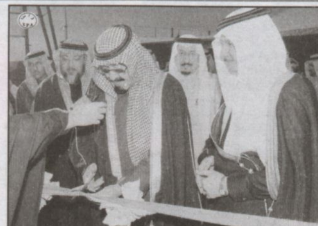
الملك عبدالله بنص شريطاً لتدشين الوحدة السكنية النموذجية

المالية للمؤسسة حسبما تحدد اللوائح التنفيذية للمؤسسة وما يقرره مجلس الامناء. تكون السنة المالية للمؤسسة متوافقة مع السنة المالية للدولة باستثناء السنة الاولى حيث تبدأ من تاريخ مزاولة المؤسسة لنشاطها في اي وقت من السنة وتنتهي بنهاية الشهر الاخير من السنة المالية التي تليها ويحدد مجلس الامناء تاريخ بدء المؤسسة لنشاطها. تتمسك المؤسسة دهاتر محاسبية نظامية وتعد قوائمها المالية وفقاً لمعايير المحاسبة والاقواق والوصايا النقدية والعينية والعوائد الاستثمارية لاموال المشروع والدخل من بيع مؤسسة غير هادفة للربح. تتم مراجعة وتدقيق حسابات المؤسسة وفق معايير المراجعة السعودية من قبل محاسب قانوني