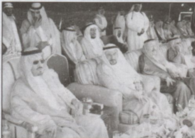
الأمير سعود بن عبدالمحسن خلال زيارته وحضر الأساس لآحد مشاريع المؤسسة في حال

وتتكون الوحدة السكنية من اربع غرف متعددة الاستخدام ومطبخ ودورتي مياه بمساحة اجمالية تبلغ حوالي (٢١٧٥)م ٢ . تخصص الغرفة التي تقع في مقدمة الوحدة السكنية مجلساً للضيوف الرجال وللإستقبال