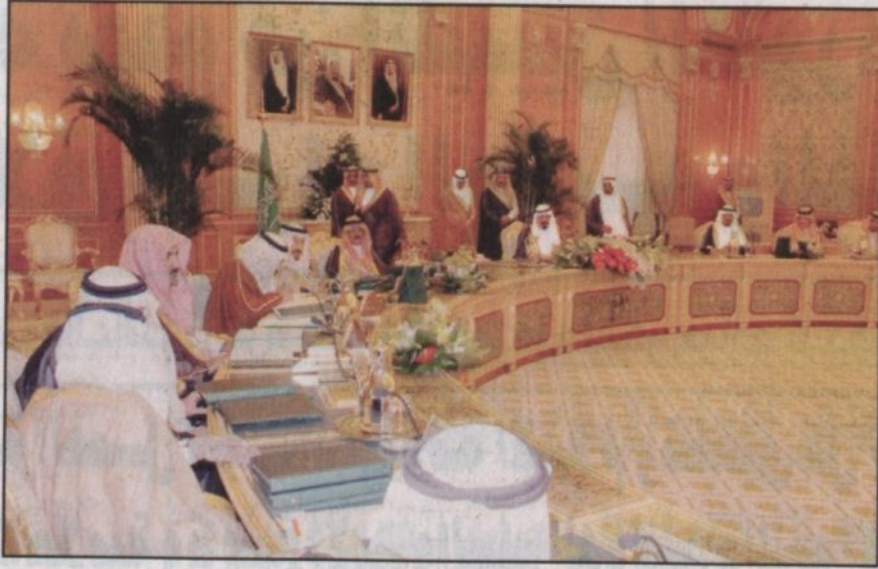
خادم الحرمين متراً جلسة مجلس الوزراء