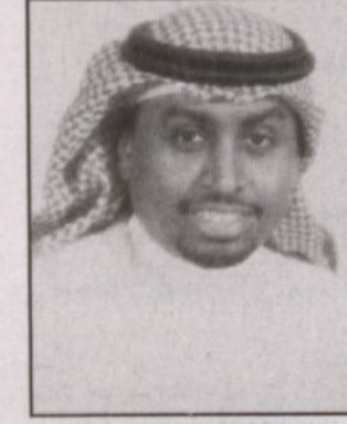
محمد بن عبدالله السعود

قبل عدة أيام أمنا فقدان والدنا ومعلمنا الفهد بن عبد العزيز داعياً للمولى أن يتفهم برحمته ويسكنه فسيح جناته، فيصمت بعد بلدنا الحبيب واضحة جدا خاصة منذ بداية تولي الحكم رحمه الله قبل أكثر من عشرين عاماً.