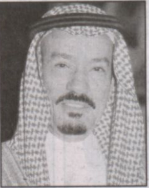
*عبدالرحمن بن علي الجريسي

لقد عشت مثلي مثل كل مواطن أتباع الأحداث التي مرت بالمملكة خلال أسبوع من الزمان، عندما جاء نيا وفدا خادم الحرمين الشريفين الملك فهد بن عبدالعزيز يرحمه الله، حيث كانت الأنظار مشدودة بحكم جسامة الحدث في ذاته، وجسامة المسؤولية الكبيرة التي سلت على قيادة هذا البلد وولادة الأمر فيه، وهي مشدودة أيضاً عند النظر إلى البعد التاريخي الذي يمر بها منفتحة بل والعالم أجمع، والتي أثبتت قيادتها تجاهها مزيداً من الحكمة والحكمة السياسية، والممزوجة بمزيد من العقلانية والتروي في التعامل معها.