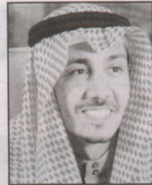
بقلم الدكتور عبدالعزيز بن علي الموسوي

حتى أصبحت إحدى الآليات المهمة الداعمة للاقتصاد الوطني وما كان لها أن تتبوأ تلك المكانة المرموقة إلا بفضل ذلك الاهتمام الذي وجدته في هذا العهد الزاهر بدرجة عززت من دورها وهطلت أداها. إن أعمال وإنجازات ومواقف القائد العالي تجسد فداحة الخلق وتسري في أعماق العالم أجمع ولا تنحصر في أحران شعبه، والام أمته، لأن عطاءه الإنساني وأبديه البيضاء وهفوه الثاقب تشهد بأنه الله مرمزا عالميا وقائدا فتدا. فرحم الله قائدنا العالي وأسكنه فسيح جناته وعزأنا في أخيه خادم الحرمين الشريفين الملك عبد الله بن عبدالعزيز آل سعود الذي نامل منه مواصلة هذه المسيرة المباركة لخير بلادنا وشعبنا وأن يسير على ذات النهج الرفيد مستمينا بالله وتوفيرة للمناخ المتنامي من الحماية والفرص الاستثمارية للعديد من التسهيلات..