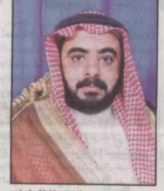
عبدالله التويجري وكيل محافظة رفحاء