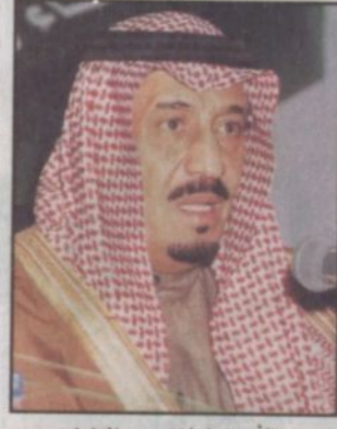
الأمير سلمان بن عبدالعزيز

كتب - مندوب «الرياض» استقبل صاحب السمو الملكي الأمير سلمان بن عبدالعزيز أمير منطقة الرياض ورئيس مجلس إدارة الجمعية الخيرية لرعاية الأيتام (إنسان) معالي الدكتور حمود بن عبدالعزيز البدر أمين عام الجمعية الخيرية لرعاية الأيتام برفقة بعض مسؤولي الجمعية وعدد من الأيتام الذين ترعاها الجمعية حيث قدموا واجب العزاء في فقيد الأمة العربية والإسلامية خادم الحرمين الشريفين الملك فهد بن عبدالعزيز (رحمه الله) وذلك بكتابة سموه بنصر الحكم.