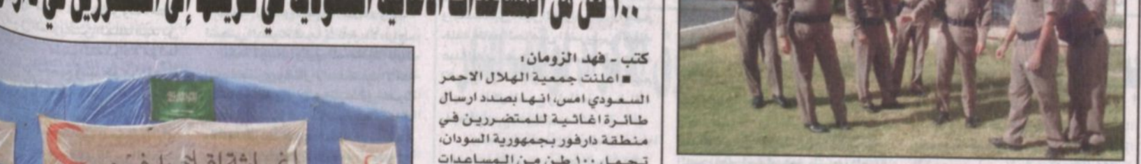
اللواء الجميد وعدد من قيادات الدفاع المدني في الأضلاع