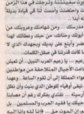
إبراهيم بن محمد الجرايين الدوسري

وداعاً فهد بن المحبة الصافي الذي لا يفيى .. وداعاً ياها الوالد القائد والمعلم .. وداعاً يا جسر المحبة والتواصل بين مواطني المملكة وشعب العالم .. بجزئنا جدا فراقك يا قائد السيفنة ... يا صانع التقدم والنجد ... يا رجل المرحلة التاريخية الضميمة الذي أعطانا الهوية، ومحبة واحترام جمع شعوب الأرض وقبائدها من خلال حكمته يا زعيم العرب بلا منازع .. عزواننا، الملك الذي تقبب بضعفنا بعد أن جعلتنا جميعاً لغفرانك وبالمملكة ورفع رأسنا عاليا .. أنت يا زعيم العرب الذي كانت سعة صدرك بسعة بوادينا وامتداد صحرائنا، يطول شواطئنا، وترامي بحومنا الزرقاء وعلو جبالنا .. عزواننا أنك أكل ما لفلتنا حولنا شرقاً وغرباً شمالاً وجنوباً تراك موحوها في كل بناء وفي كل صرح .. في جبالنا وسحراننا وشواطئنا .. بل في كل زاوية من زوايا المملكة الذي بنيت والذي قام وكبر ورفعا في بل وتعلق على يديك.