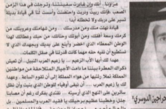
إبراهيم بن محمد الجرايين الدوسري

وداعاً فهد بن المحبة الصافي الذي لا يفيش... وداعاً أيها الوالد القائد والمعلم... وداعاً يا جسر المحبة والتواصل بين مواطني المملكة وشعب العالم... بجزئنا جدا فراقك يا قائد السيفنة... يا صانع التقدم والمجد... يا رجل المرحلة التاريخية الضميمة الذي أعطانا الهوية، ومحبة واحترام جمع شعوب الأرض وقبائلها من خلال حكمته يا زعيم العرب بلا منازع... عزوانا... أنك لن نقبب بشعرك بعد أن جعلتنا جميعاً لغفور بك وبالمملكة ورفع رأسنا عاليا... أنت يا زعيم العرب الذي كانت سعة صدرك بسعة بوادينا وامتدادنا صحرائنا، يطول شواطئنا، وترامي بحونا الزرقاء وعلو جبالنا... عزوانا أننا نكل ما لفلتنا حولنا شرقاً وغرباً شمالاً وجنوباً تراك موحوا في كل بناء وفي كل صرح... في جبالنا وصحرائنا وشواطئنا، بل في كل زاوية من زوايا المملكة الذي بنيت والذي قام وبكر وعاين بل وتعلق على يديك. ذك في وجود أطفالنا، وفي القلدة أبلانا سير تحكي التاريخ للملكة والعالم للمواقف والقرارات والسجايا والانتصار للحق... عزوانا أنك تركت لنا اقتصاد المملكة أنجح من نوعه عربياً... وعالمياً... وأنتك شيدت لنا دستور الحكم يستطوع أن يحرس المملكة في جبالنا... عزوانا أنك رحل رحيل الرجال العظيم صاحب مرفق الرأس بأبوابك البيضاء التي تم ترك شبرا من أراضي العرب والمسلمين والعالم إلا ووصات إليه بالخير تبني المساجد والمدارس والمستشفيات.