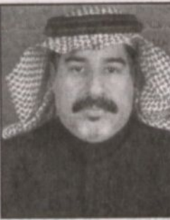
عبد الرحمن بن محمد

رحم الله خادم الحرمين الشريفين الملك فهد بن عبدالعزيز رحمه الله أن يفتحن وجهه لكل ما قدمه في موازين حياته. لن نستطيع إلا أن نقية حقه مهما سطر، ولن نستطيع القول أن تذكر كل ما قدمه لشعبه ولوطنه، وكيف رحمه الله ما بذله في خدمة الحرمين الشريفين وكل مرحلة من مراحل عمره حقق فيها إنجازات عظيمة وبتروحات مملعة حتى حقق للمملكة العربية السعودية مكانة في العالم أجمع، وهو الذي أسس قواعد الأمن والاستقرار في هذه البلاد، وقدم رحمه الله كل ما بوسعه من سبل في سبيل دفع مجالة الاقتصاد إلى الأمام، وعمل على تطوير الأنظمة في كافة القطاعات، رحم الله الملك فهد رحمه الله وأسكنه فسيح جناته، رحيل الرجال العظيم صاحب مرفق الرأس بأبوابك البيضاء التي تم ترك شبرا من أراضي العرب والمسلمين والعالم إلا ووصات إليه بالخير تبني المساجد والمدارس والمستشفيات.