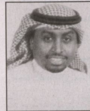
محمد بن عبدالله السعود

قبل عدة أيام أمتنا فقدان والدا ومكنا المفدى بن عبد العزيز داعين المولى أن يتقدمه برحمته ويسكنه فسيح جناته، فيصمت بعد بلدنا الحبيب واضحة جدا خاصة منذ بداية تولي الحكم رحمه الله قبل أكثر من عشرين عاماً.