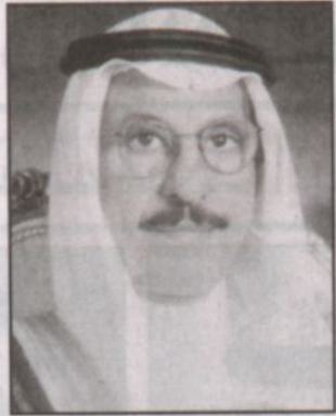
بقلم: نجم بن عبدالله أبو حنين

رحل القائد وترجل الفارس وشعبه وأمتة لا زالت تتذكر ما قدمه خلال حكمه للعربية والإسلام والإنسانية، إن ما تتداوله وسائل الإعلام المحلية والعربية عن الملك فهد رحمه الله هي إلا لمحات موجزة لمسيرة امتدت أكثر من عشرين عاماً لقائد مسيرة ناجحة وقبيلها كان رحمه الله مشاركاً وفعاليتها ملموسة في مسيرة الخير والتنمية لهذه البلاد الطاهرة من