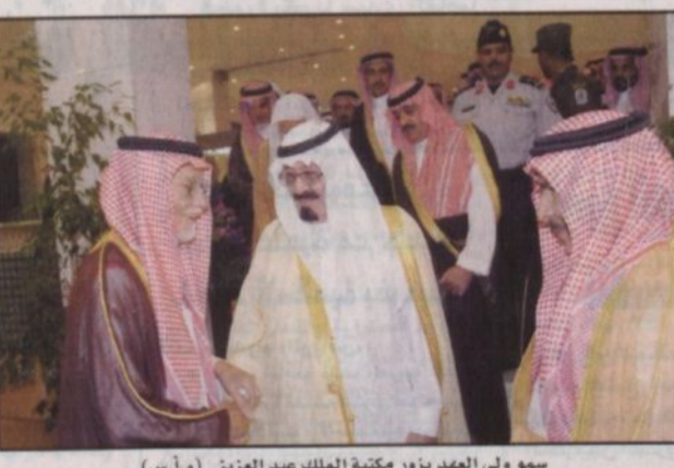
سما ولي العهد يزور مكتبة الملك عبد العزيز أعماله وطموحاته من إقامة هذا الصرح الثقافي الذي يتشرف بحمل اسم مؤجد البلاد مشيداً بما تحقق من إنجازات ملموسة للمؤسسات الثقافية

والعلمية في المملكة. وأضاف أن الأمير عبدالعزيز أكد أن على الجميع واجب التصدي للممارسات التي تشتم باسم الإسلام وهو منها بريء عن طريق مكافحة الفكر المنحرف وكما فعلت في عصر ثلاثت فيه الثقافات والحضارات وتجادلت على صعودها والاتصالات. والمكتبة التي تتحقت خلال العشرين والعلمية في المملكة. وأضاف أن الأمير عبدالعزيز أكد أن على الجميع واجب التصدي للممارسات التي تشتم باسم الإسلام وهو منها بريء عن طريق مكافحة الفكر المنحرف وكما فعلت في عصر ثلاثت فيه الثقافات والحضارات وتجادلت على صعودها والاتصالات.