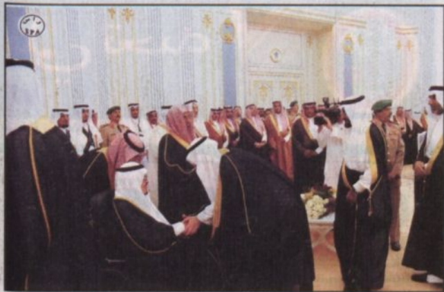
أعضاء مجلس الشورى يتشرفون بالسلام على خادم الحرمين