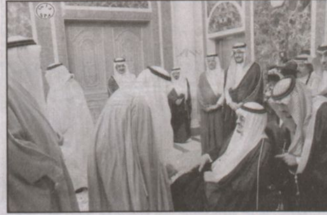
خادم الحرمين خلال استقباله رئيس وأعضاء مجلس الشورى