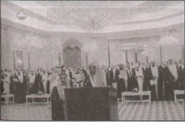
رئيس وأعضاء مجلس الشورى يؤدون اليمين بين يدي خادم الحرمين