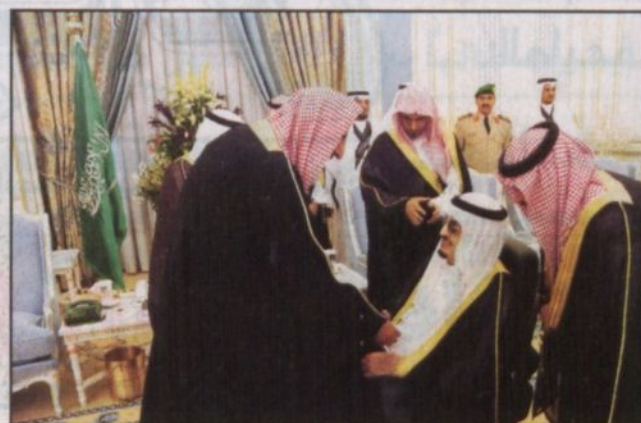
خادم الحرمين يصافح المفتي العام قبيل الاستقبال