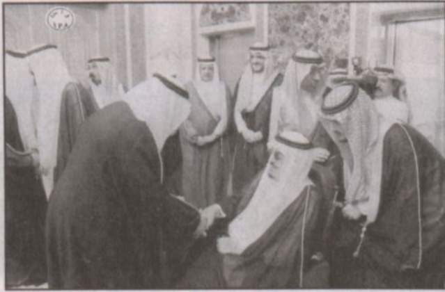
خادم الحرمين يصافح أصحاب السمو والمعالي حضور الاستقبال

ومع أن هذه الوقائع جلية وواضحة استغرب أنه لم يؤخذ منها أي مؤشر يستدعي لجم الإرهاب في إرهاباته الأولى ومحاصرتها وهو جنين لم يتمرد بعد.. كلنا يذكر ما كان يحدث أثناء حرب تحرير الكويت.. ما كانت بعض أسرطة الكاسيت تروجه، ولم يكن هناك من يجرد على إيقاف ذلك الإرجاف الذي كان جزءاً من الإعداد لموجة الإرهاب.. واستغرب بعد عملية (الرس) الأخيرة أن يقول مسؤول في موقع مرموق.. عندما وجه إليه سؤال عن دور المجتمع في مواجهة الإرهاب.. إن على الوالدين مسؤولية إعداد أطفالهم وتربيتهم تربية صالحة.. من قال إن الأطفال قد حملوا السلاح في موجات الإرهاب؟ أين المسؤولية عنهم يتلقون الإرهابية التطرف والانطواء والخوف من ضده سلامة المجتمع وأمنه؟ نحن الآن وأمام الانتصار الأمني الذي يعتز به كل مواطن يجب أن نعين الأمن بأن تقوم الجهات المعنية بمكافحة التطرف والانطواء والخوف من كل جديد بممارسة مسؤولياتها.. ليس ضد أحد.. ولكن بمواجهة الحقائق وتحويل مواقف تأثير هي سلبية في بعض الحالات إلى مواقع تأثير إيجابية في كل الحالات لأنه لا فارق كبير بين من يكفر الدولة والمجتمع أو من يكفر المجتمع..