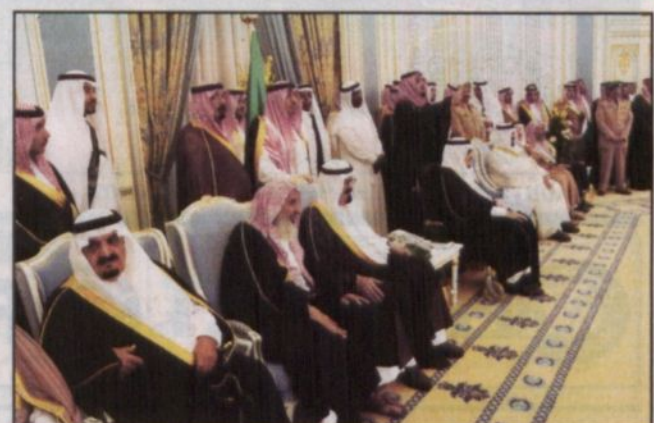
خادم الحرمين وولي العهد والأمير مشعل والأمير سلطان والمفتي العام خلال الاستقبال

د. ابن حميد وطيبة ود. العلي ود. المالك وأعضاء المجلس أدوا القسم بين يدي خادم الحرمين