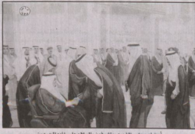
أعضاء مجلس الشورى يتشرفون بالسلام على خادم الحرمين

وزارة الخدمة المدنية فيما يتعلق بإجراءات الأورثان في شأن استقدام العمالة.