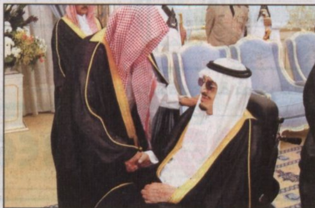
خادم الحرمين ورئيس مجلس الشورى