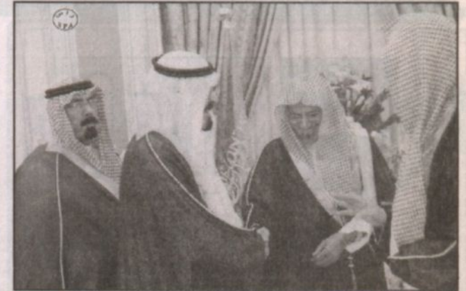
ولي العهد ورئيس مجلس الشورى خلال الاستقبال