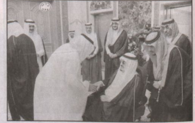
خادم الحرمين الشريفين خلال الاستقبال