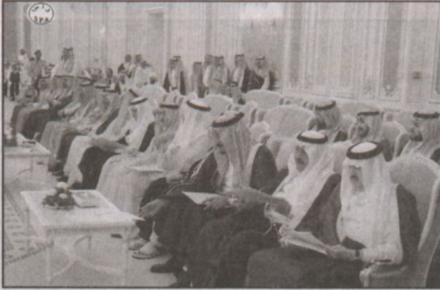
أصحاب السمو الملكي الأمراء خلال الاستقبال