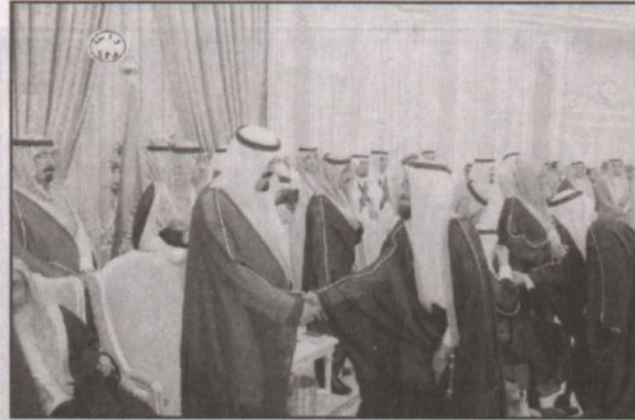
الأمير عبدالله يصافح أعضاء المجلس