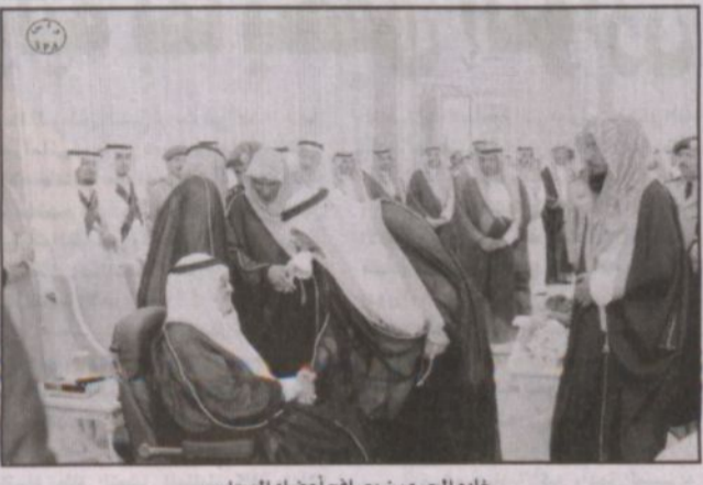
خادم الحرمين يصافح أعضاء المجلس

لتجنب سوات المحنة والاستفادة من دروسها وأخذ العبرة من ظروفها ومعالجة أسبابها والتعامل بحكمة وأناة مع ما تبعا من مظاهر العنف والإرهاب فسات سنية هذه البلاد محفوظة برعاية الله ميمونة بتوفيقه ثم يخطه رجال الأمن وبسالتهم محاطة بوعي المواطن وفكر الحكام من العلماء والمثقفين والدعاة وكان من توفيقه تعالى أن يسر لهذا المجلس السهام بتصحيح غير اتصالاته الخارجية المكثفة والمشاركة الفاعلة في المؤتمرات وعبر سن الانظمة والاستراتيجيات واصدار القرارات وايداء الآراء والمخترحات لمساندة دور الحكومة ووجودها في تجاوز هذه الازمة.